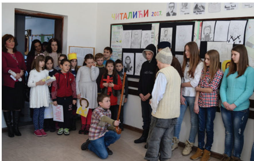
Ђаци припремили рецитације, скичеве и два драмска комада