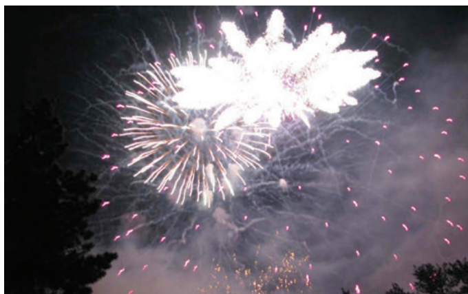
Тачно у поноћ планину је обасјао феноменални ватромет

Прве вечери у Новој 2017. години атрактиван концертни програм је настављен врхунским рок дешавањем. Пред посетиоце Златибора изашла је популарна «Рибља чорба». Култни рок састав Боре Ђорђевића ускоро обележава 40 година постојања и успешног стваралаштва, а на Краљевом тргу уприличио је величанствену журку концертом који ће се дуго памтити. Плато златиборског трга био је препун, а публика је у прохладној ноћи уживала уз непревазиђене и увек актуелне хитове и стихове са многобројних албума ове