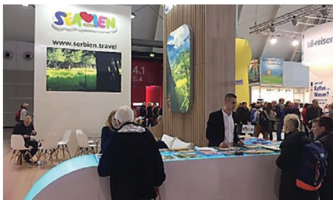
Поред сајмова, биће побољшана и презентација путем друштвених мрежа и интернет портала