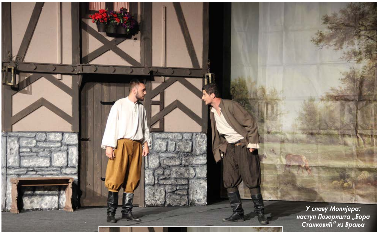
У славу Молијера: наступ Позоришта „Бора Станковић“ из Врања

писаца који традиционално учествују и у манифестацији „Песничке ватре златиборске“.