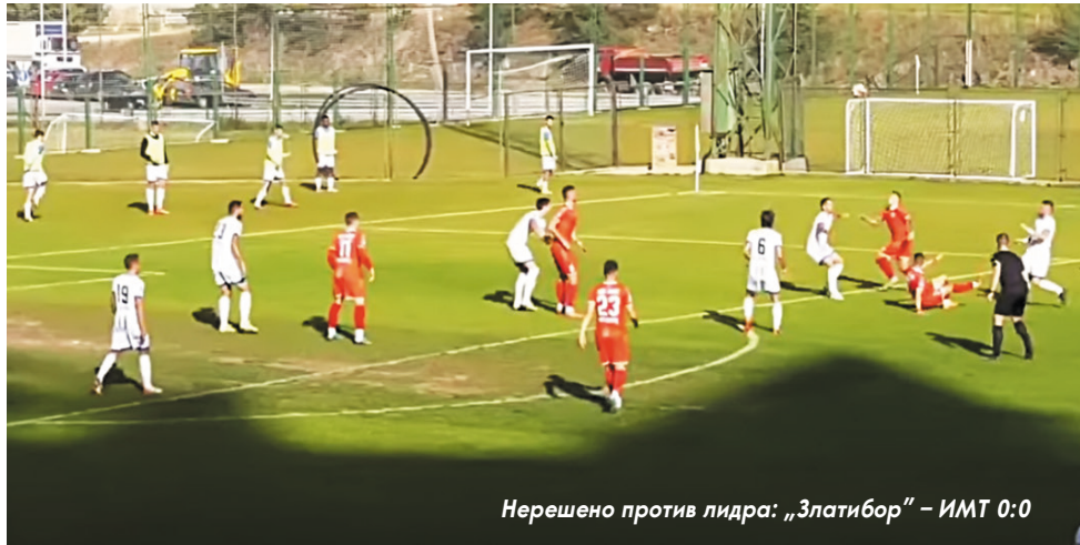
Нерешено против лидера: „Златибор“ – ИМТ 0:0

Била је ово осма узастопна утакмица без победе у првенству за „Златибор“ који је на