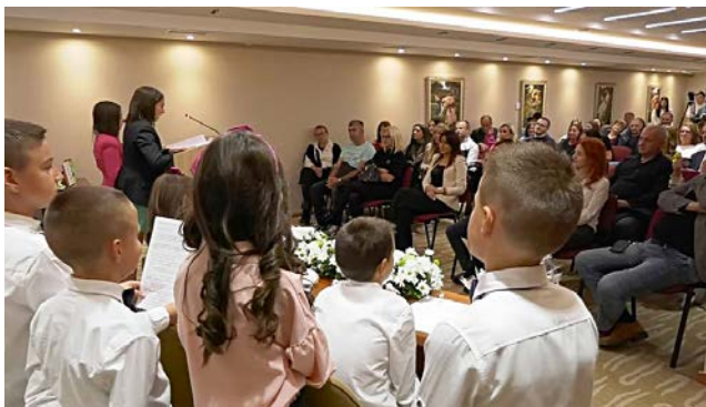
Велики одзив и подршка хуманитарној трибини „Нико не сме да буде сам“

„ДИНО КЛУБ“ ДЕЦИ БЕЗ РОДИТЕЉСКОГ СТАРАЊА