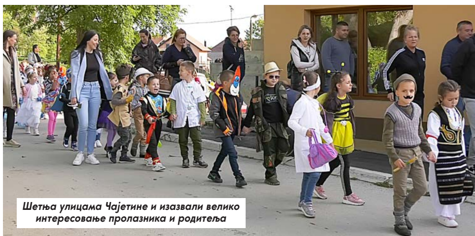
Шетња улицама Чајетине и изазвали велико интересовање пролазника и родитеља

У Предшколској установи „Радост“ било је весело, шарено и раздрагано због маскенбала који су приредили малишани од три до шест година