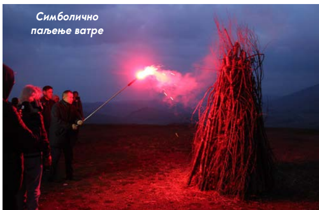
Симболично паљење ватре

На Златибору је у недељу, 9. октобра, одржана девета манифестација „Песничке ватре златиборске“ у славу 400 година од рођења Молијера