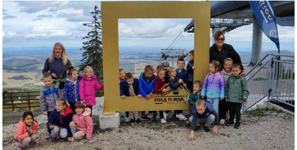
У оквиру Дечје недеље гондолом се провозало око 500 ученика из свих основних школа и вртића са територије општине Чајетина

– Сарадња с нашим кошаркашима дошла је у правом тренут-