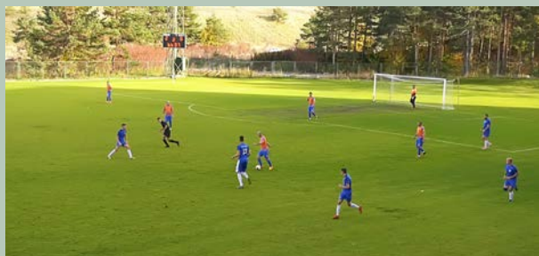
Резултати добри, пласман одличан: фудбалери „Чајетине“

Екипа Чајетине је почела сезону без великих очекивања, али су резултати добри па је екипа на четвртм месту са три бода мање од лидера „Полета“ из Расне. Екипа је током лета