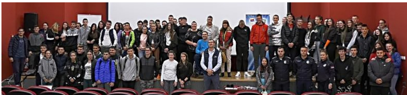
Предавању је присуствовало око 120 средњошколаца из Чајетине, Ариља, Прибоја и Пријепоља

П о статистичким подацима, угроженост младих у саобраћају је велика, било да је реч о њиховом учешћу као возачима, сапутницима или пешацима. Тешка саобраћајна несрећа која се недавно догодила на путу Ужице-Златибор, подигла је јавност на ноге са циљем да се предоче узроци, али и последице неодговорног понашања младих у саобраћају. На предавању је скренута пажња младима колико је важно да имају исправне ставове о сопственој, али и о безбедности свих учесника у саобраћају.