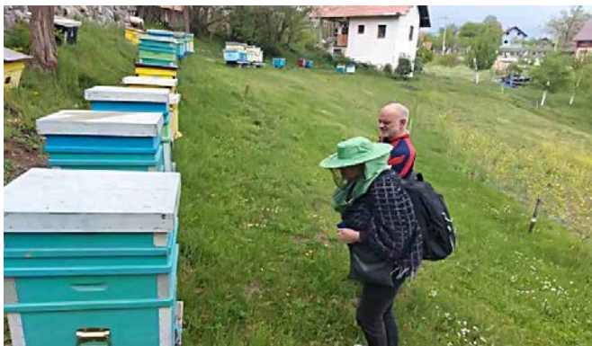
Један од корисника жига „Добро са Златибора“