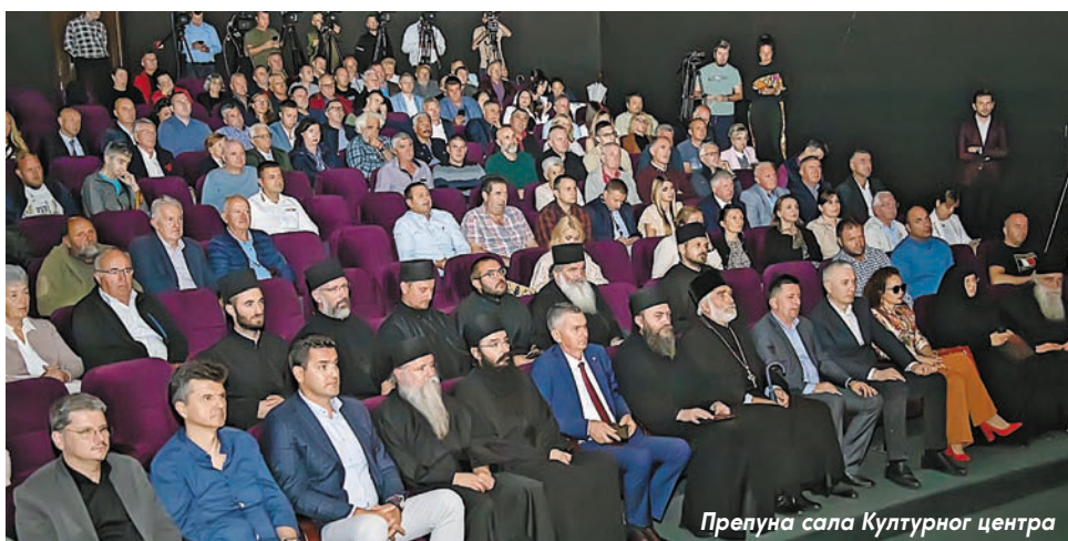
Препуна сала Културног центра

Парцела је на километар и по од урбаног центра Златибора, када се крене према Цр-