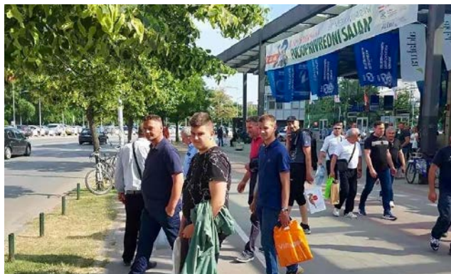
Произвођачи на Пољопривредном сајму