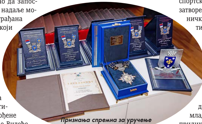
Признања спремна за уручење

– Стратегијом развоја општине равномерно смо развијали и сва наша села, изградњом путева, довођењем пијаће воде, изградњом сеоских вртића, тако да не чуди долазак великог броја младих у наше сеоске средине. Овом приликом би их позвао да се пословно