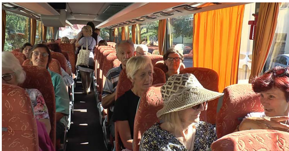
Добро друштво за још боље расположење

Иначе, организован је и излет у Сирогојно и Гостиље, као и одлазак на лето-