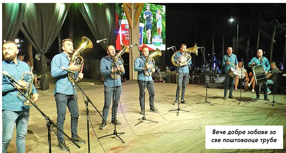
Вече добре забаве за све поштоваоце трубе