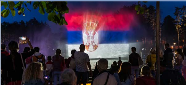
Мултимедијална фонтана на језеру изазива велику пажњу туриста

Аутор пројекта је Милан Кулић, а радове на сценском, декоративном и јавном осветљењу је извела фирма „Fina tehn led“ из Београда. Инсталирана је опрема познатих светских произвођача у овој области, компанија ХБ ласер из Немачке и Игучини из Италије.