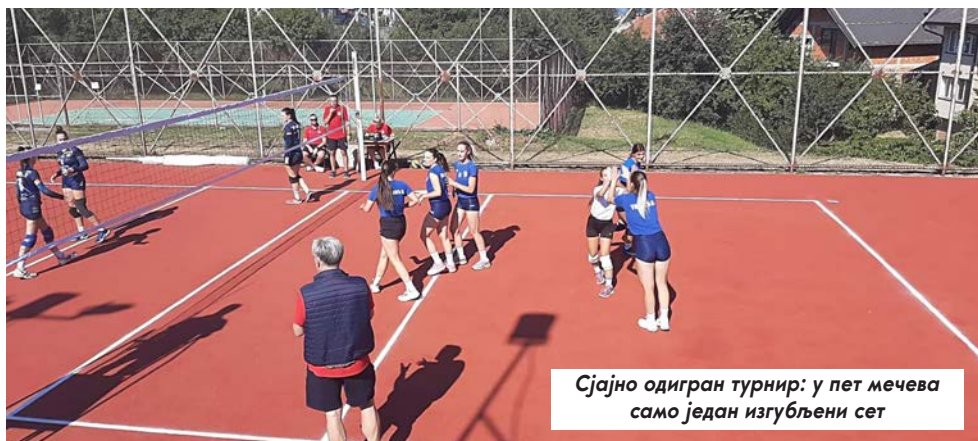
Сјајно одигран турнир: у пет мечева само један изгубљени сет

Екипа је до злата стигла најпре победама у групи над Гораждем, што се испоставило као најтежи меч, домаћином Новом Вароши и Бајином Баштом. Та-