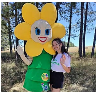
Нарциса, нова маскота