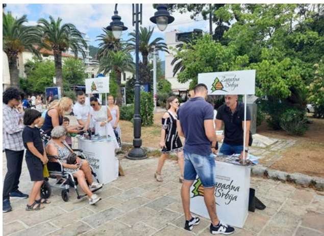
Промоција Туристичке организације у Црној Гори