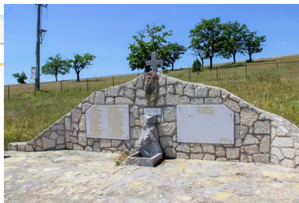
ЦИГЛА У ЈАБЛАНИЦИ