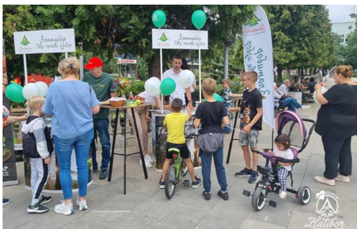
Веома успешна промоција по трговима

У оквиру ове кампање је представљен и пројекат „Покрени зелену турсу“, у сарадњи са фирмом „Возим на струју“. Имајући у виду све већу загађеност животне средине у свету и настојања Општине Чајетина да буде прва еколошка општина у Србији, ТО Златибор покренула је овај пројекат који посетиоцима омогућава да обиђу Златибор на један другачији начин, користећи возила која су потпуно еколошки прихватљива (100% на струју), као и бицикле које имају електроасистенцију, а могу се користити и као обичан бицикл. Посебна атракција је могућност изнајмљивања електричних аутомобила за обилазак најпознатијих локалитета у околини Златибора. ТО Златибор је у сарадњи са фирмом „Возим на струју“, промовисала пројекат „Покрени зелену турсу“ на деветом Међународном „Тесла релију“, одржаном на шеталишту поред хотела „Југославија“ у Београду, као и на првом Сајму коришћених возила, који се одржао у престоничкој „Штарк арени“.