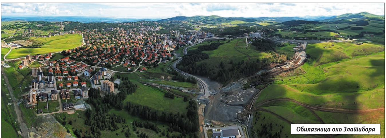
Обилазница око Злайшбора

„Повољном исходу допринело је и што су се створиле прилике у смислу промене захтева савременог туристе, а то смо ми на прави начин пратили и од запушеног туристичког подручја након 2000. дугогодишњим вредним улагањима и остварењем смелих визија, дошли у ситуацију да општина Чајетина данас важи за најбољу у туризму, и једну од најперспективнијих локалних самоуправа“