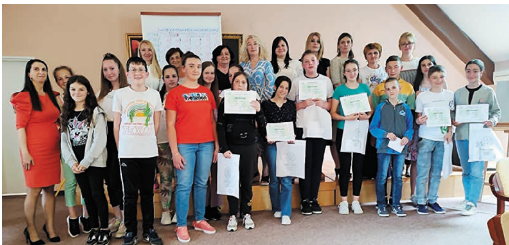
Учесћивало је шест екипа ученика школа из Мачката, Шљивовице, Сирогојна, Љубиша, Чајетине и Златибора

По њеним речима, свест о очувању животне средине је код деце