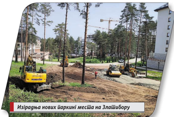
Изградња нових паркинских места на Златибору