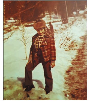
Чајешинска зима 1976.

Када сам кренуо у школу једва сам знао да читам, нисам ишао у обданиште (није га ни било) и чувала ме је баба,