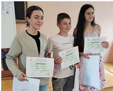
Друго место припало је ђацима ОШ „Димитрије Туцовић“ са Златибора