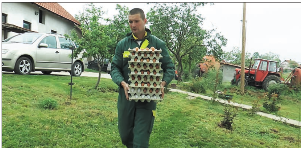
Проблема око пласмана нема, како би подмирили све потребе планира се проширење капацитета

– Од крупне стоке имамо девет крава музара, 15 свиња, 30 оваца и око 500 кокошака носиља и товних пилића – прича Радоје. – Син је кренуо са производњом органских јаја па ћемо видети како ће проћи, с обзиром да је дошло до поскупљења сточне хране а от-