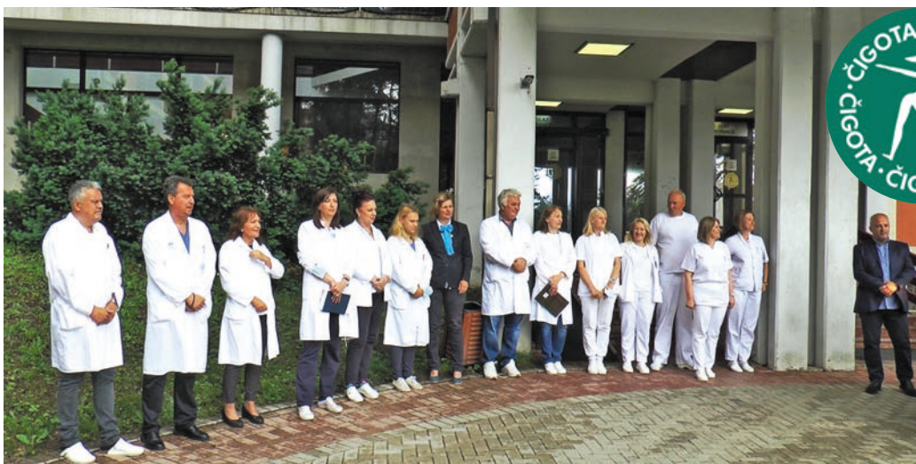
Мала свечаност поводом пријема санитарског возила

Колико значи ова донација говори и то да своје санитарско возило нису имали више од 30 година, већ је за ове потребе коришћен обичан путнички аутомобил