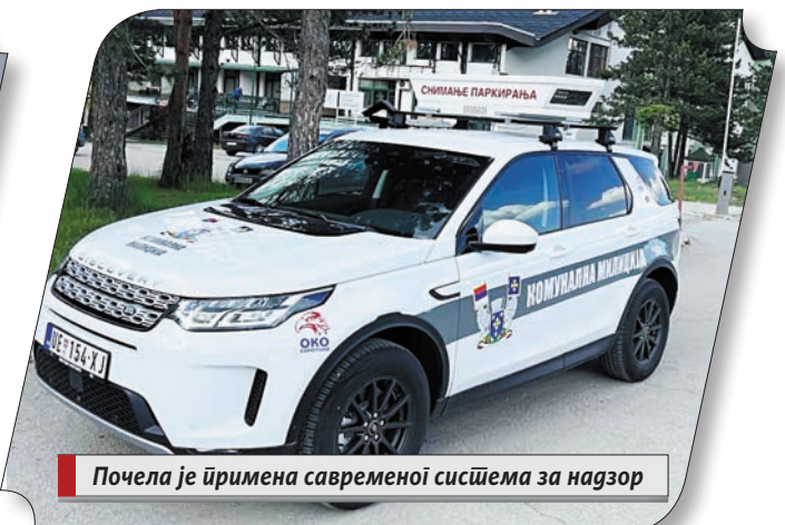
Почела је примена савременог система за надзор