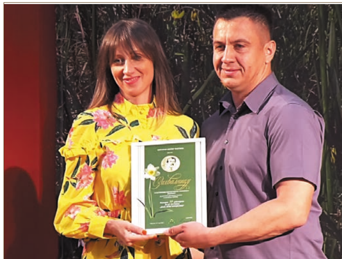
Под покровитељством општине Чајетина прославили смо тридесет година постојања Фестивала „Деца међу нарцисима“

Трудимо се да на свим пољима будемо подједнако добри и посвећени задацима