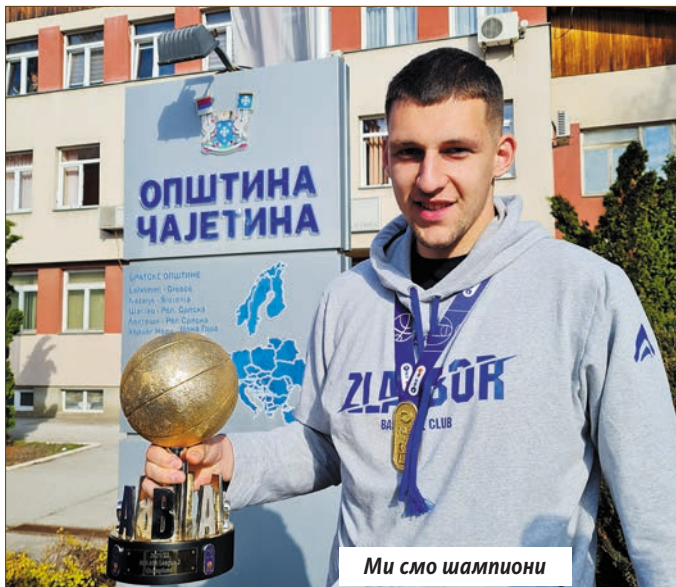
Ми смо шампиони