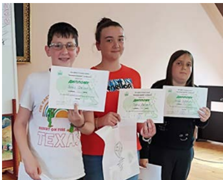
Прво место је освојила екипа из Основне школе „Миливоје Боровић“ из Мачката