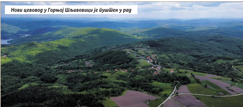
Нови цевовод у Горњој Шљивовици је пуштен у рад

Највећи реализовани пројекат за нама је свакако је постројење за пречишћавање отпадних вода „Златибор“. Приликом градње тог постројења посебно се имало у виду да се пројектује и гради за туристичко насеље са израженим сезонским променама, па се току једне године могу очекивати велике промене оптерећења отпадне воде, како хидрауличка, тако и органска, па је зато постројење је флексибилно пројектовано. У реку Обудојевицу, а касније и у Црни Рзав и Дрину, иде само пречишћена отпадна вода.