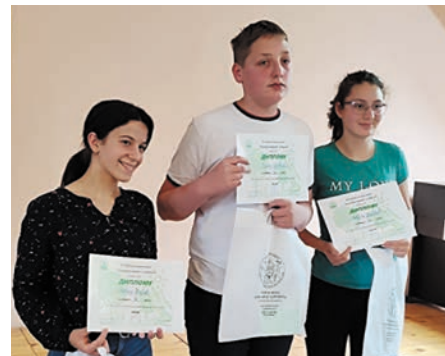
Екипа ОШ „Саво Јовановић Сирогојно“ из Сирогојна припало је треће место