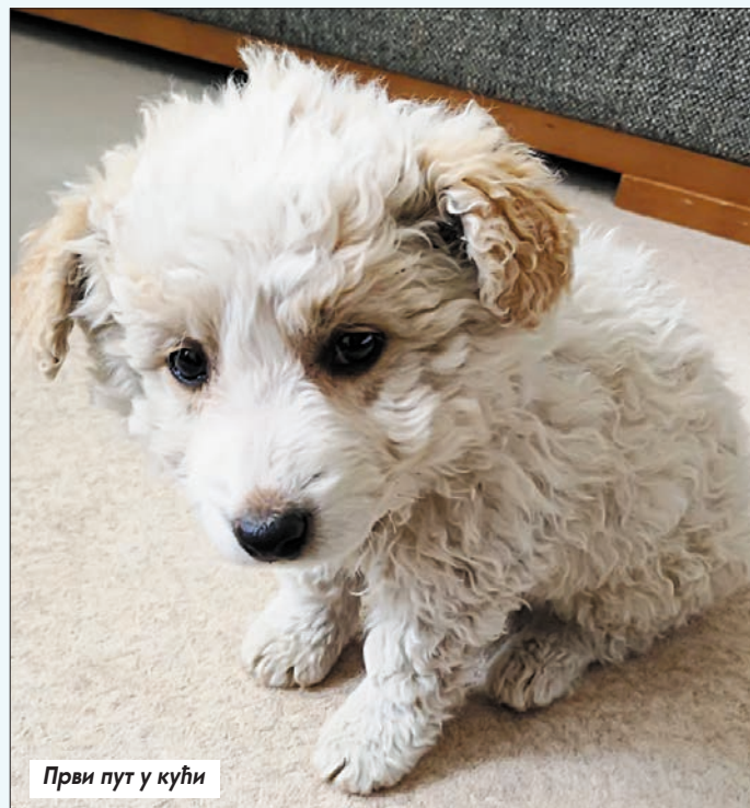
Први пут у кући

– Неко на деск-топу држи фотографију родитеља, девојке, супруге или деце, а ја њега – прошаптао је замишљено. – Најбољег и највернијег другара. Не, моји ми не замерају, они најбоље знају шта је и како је.