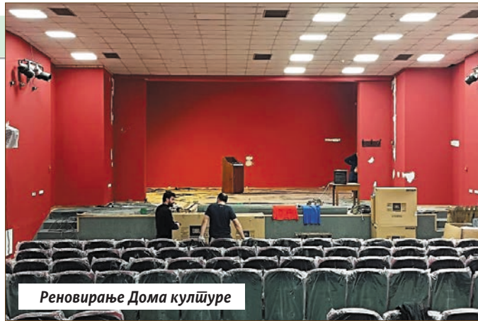
Реновирање Дома културе