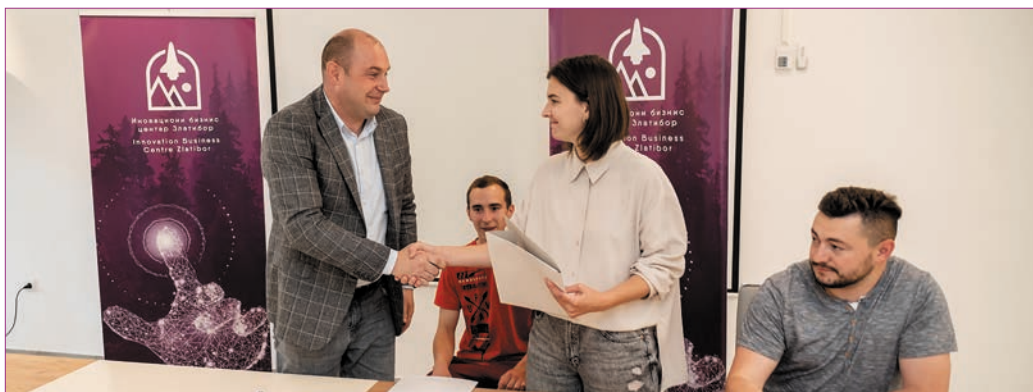
Интересовање је велико, подршку у износима до 600.000 динара већ је искористило 11 стартап-ај предузетника: дејал са ишисивања

Успешно реализован хакатон на Торнику 2021. био је само почетак оваквог вида активности за младе. Бројни економски номади, категорија радника новог доба који своје приходе реализују он-лајн, а међу којима су најбројнији ИТ стручњаци, свој простор за рад нашла је управо у coworkingu ИБЦ-а. ▲