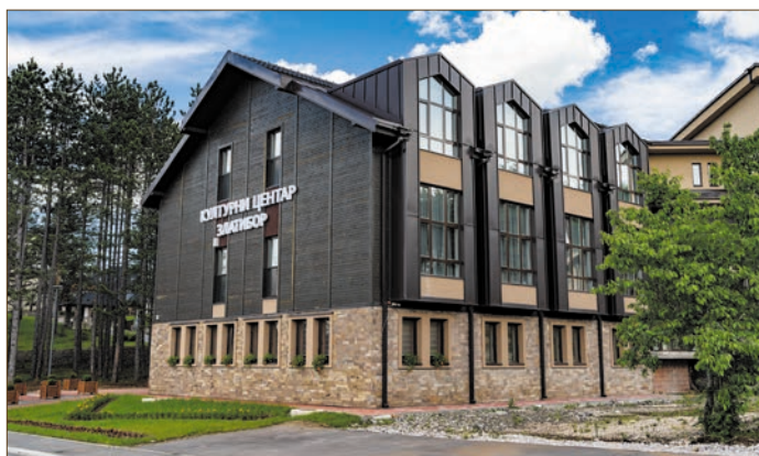
Признање „Капетан Миша Анастасијевић“ за Културни центар

године кад је постало место редовног одржавања низа фестивала. Запажен је и динамичан рад савремено опремљене Галерије где је одржан велики број изложби.