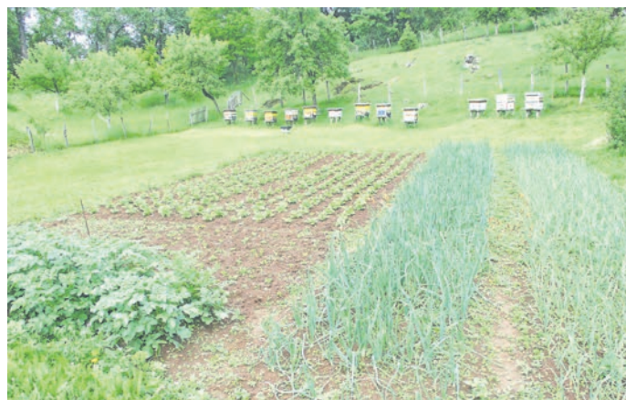
Врт са поврћем