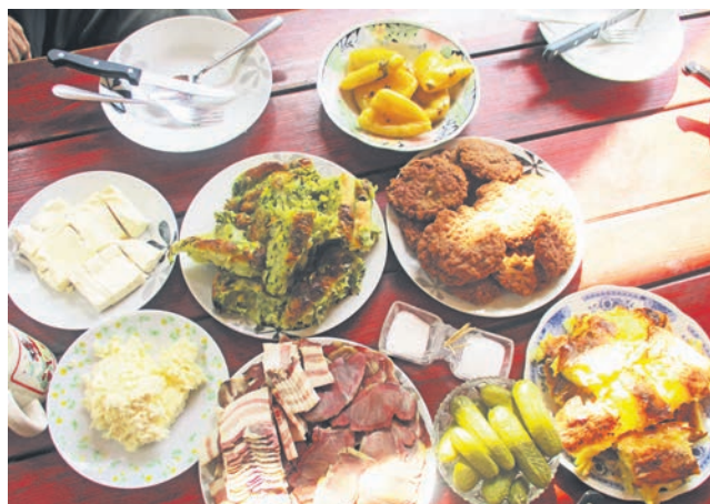
Богата трпеза домаће хране