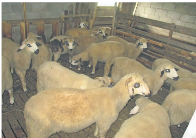
Тееунутно у тору има око 40 оваца