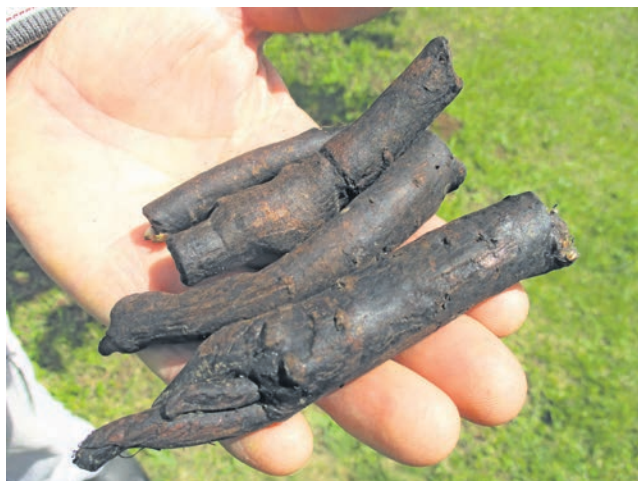
Преци Крејовића на ове просторе донели су и засадили гавез, на слици је корен ове биљке

Пошто је отац био болестан услед четворогодишњег заробљеништва у Немачкој, бремене терета се свалило на нејака дечија плећа и моју мајку