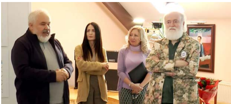
ФЕСТИВАЛ ПОЉСКОГ ЦВЕЋА