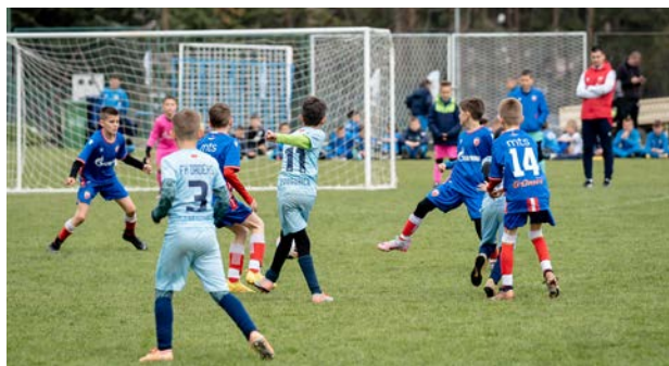
На међународном турниру „Златибор куп“ надметало се преко 1.500 деце у 8 старосних категорија

А кад је реч о актуелним културним дешавањима, у Галерији Културног центра Златибор свечано је отворена изложба под називом „Диванхана“, радова насталих у оквиру ликовне колоније на Сопотници 2022. године.