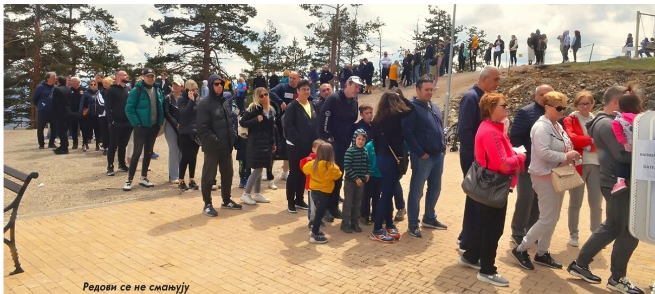
Редови се не смањују

Оваквом посећеношћу и оволиким задовољством путника, убрзо ће се најдужом гондолом на свету провозати и милионити гост, који се очекује до краја ове године.