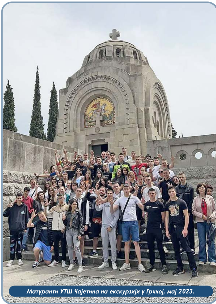
Матуранти УТШ Чајетина на екскурзији у Грчкој, мај 2023.