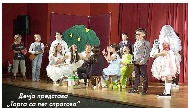
Дечја представа „Торта са пет спратова“