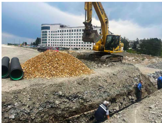
Израда канализационе мреже

У оквиру реконструкције Катунске улице спроводимо радове на унапређењу водоводне и канализационе мреже. Ови инфраструктурни пројекти ће побољшати квалитет водоводне мреже и функционалност канализационог система.