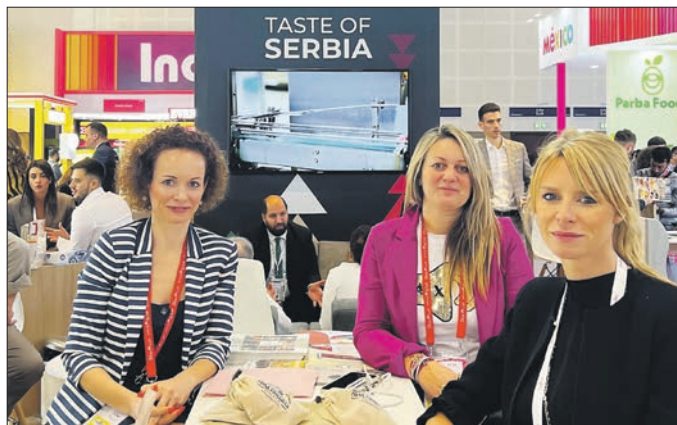
Успешно представљање у Дубају

Да би пловидба гондолом била занимљивија, запослени у ЈП „Голд гондола Златибор“ труде се да сваке сезоне гостима понуде нешто ново, па се ту нашла и атрактивна услуга бранча у ваздуху – традиционални златиборски оброк који се служи у кабинама. У њему су се нашли главни специјалитети овог краја, попут пршуте, сланине, чварака, сира и домаће пите који се служе уз домаћу ракијицу, сокове и воду. Идеја за ову иновацију била је промоција локалног предузетништва и очување локалне културе и традиције у споју са возњом најдужом гондолом на свету, што је путницима пружио доживљај Златибора свим чулима. Није заборављена ни љубав као мотив излета, па је понуда допуњена „романтичним путовањем“ у специјално деко-