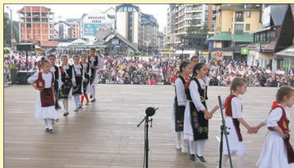
У организацији Удружења за неговоње народне традиције „Златибор“ на Краљевом тргу је одржан Први дечји фестивал фолклорних ансамбала под називом „Златиборски пољупци“

– Наш фолклорни ансамбл „Карановац“ данас је дошао са две дечје групе. Једна ће се представити са играма београдске посавине, а друга група са играма из околине Трстеника и све ће то пратити наш дечји оркестар. Деца су имала