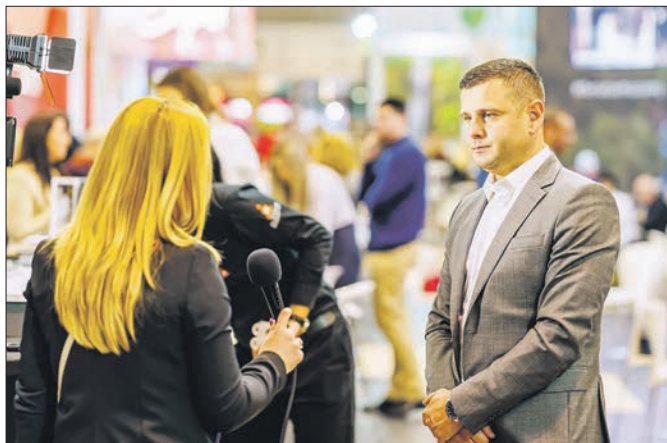
Београдски Сајам туризма

Туристичка организација Златибор редовно учествује на сајмовима туризма у земљи и свету. Током претходног периода туристичку понуду је представила на великим сајмовима у Берлину, Штутгарту, Београду и Софији, а активно учествовала и на мањим сајмовима туризма у земљи и региону (Нови Сад, Ниш, Бања Лука, Угљевик...).