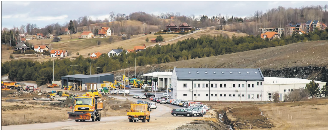
Прејходни период, између остало, обележило је остварање модерног радног комплекса чију је изградњу финансирала локална самоуправа

Основни резултати КЈП „Златибор“ Чајетина указују да ово предузеће већ годинама послује стабилно, и представља пример добре праксе у земљи и окружењу. Побољшање услова рада, јачање техничких капацитета и људских ресурса и уз бројне пројекте, представља стратегију развоја овог предузећа које обавља осам комуналних делатности.