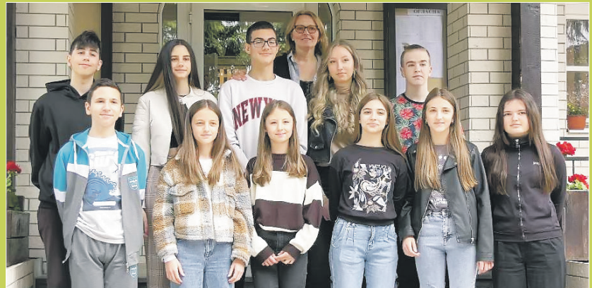
ОШ „Димитрије Туцовић“ из Чајетине дичи се својим ученицима који су показали изузетно знање на такмичењима

– Кад се уједини мој труд, разредно зала-