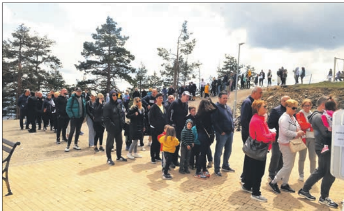
Поново је оборен дневни рекорд са више од 3.000 љушника