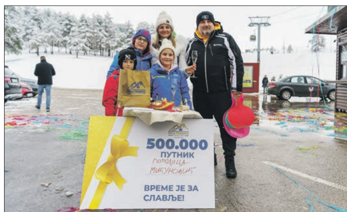
У јануару је превезен њоламилионићи љушник: њородица Мићуновић

2.549 путника. Убрзо након тога, већ 1. маја, поново је оборен дневни рекорд са више од 3.000 путника у том једном дану.