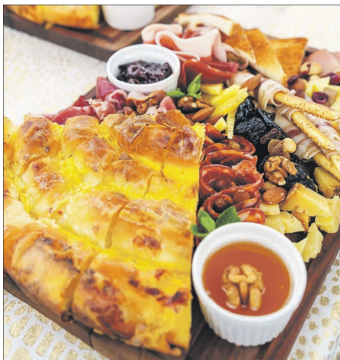
Бранч у ваздуху, иновација која је обојила вожњу

Ова година представља почетак ширења пословних активности изван граница Србије. Озбиљна сарадња покренута је присуством на тржиштима бивше Југославије, али и Блиског истока. Током неколико конференција у Уједињеним Арапским Емиратима представљени су потенцијали Гондоле и туристичке привреде Златибора уопште. Наше представљање у Дубаију је унапредило пословне односе између Србије и Емирата и ојачало развој стратешког позиционирања у оба региона. Један од наредних корака је представљање ресурса Златибора у Дубаију