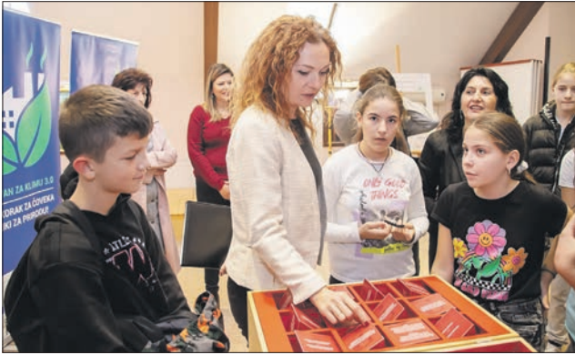
Интерактивна изложба „Караван за климу“

нић“ Чајетина из периода од 2020. до 2022. године.