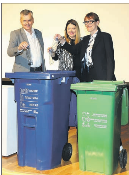
Почетак пројекта одвајања кућног отпада

Својим радом и резултатима КЈП „Златибор“ подржава тежњу Чајетине да постане прва еколошка општина у Србији предузимајући низ корака, међу којима је и увођење примарне селекције отпада, једног од најзначајнијих пројеката везаних за заштиту животне средине. Да би побољшао постојећи систем и допринело уштеди депонијског простора, примарном селекцијом обухваћена је цела чајетинска варош, а систем се постепено успоставља и у насељеном месту Златибор. Увођење поменутих новина у свакодневни живот суграђана прати и информативно-едукативна кампања, са циљем подизања свети о значају пројекта, као и упознавање са оствареним резултатима који су постигнути захваљујући суграђанима који одвајају отпад на месту настанка, чиме дају свој лични допринос да овај пројекат буде што ус-