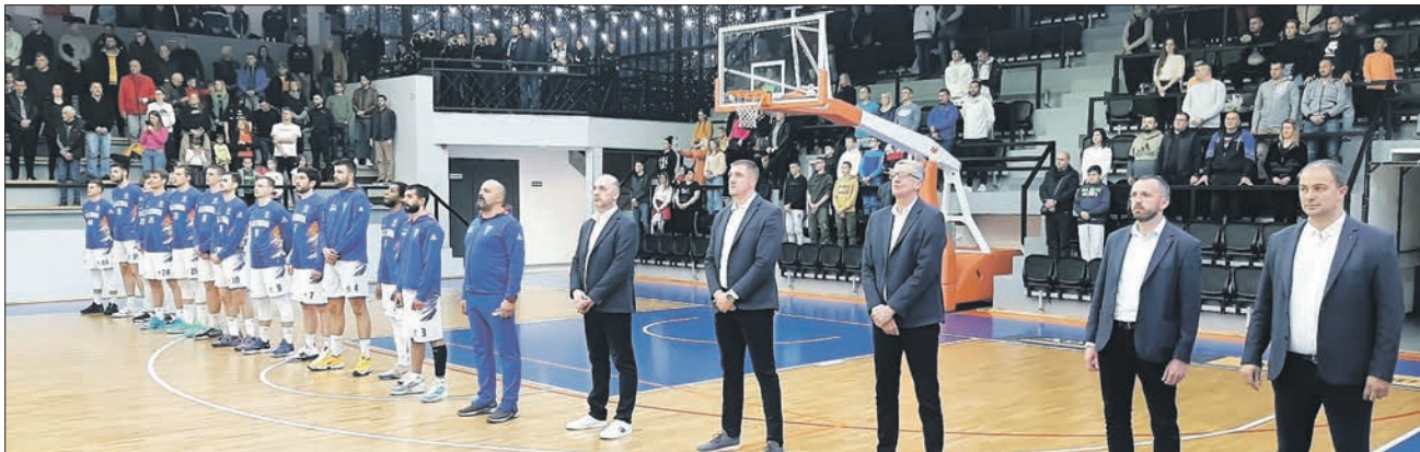
КЦ „ЗЛАТИБОР“: УМЕСТО РЕЗИМЕА