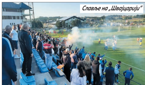
Славље на „Швајцарији“

На крају утакмице последњег кола у овој сезони почело је велико славље домаћих играча и бројних навијача који су направили бакљаду којом су улепшали спортски амбијент.