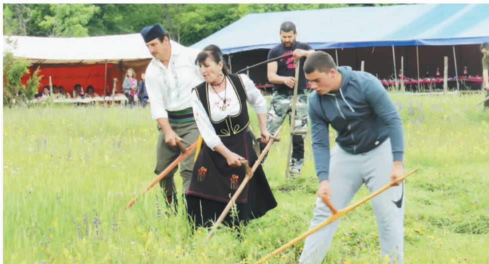
Међу 22 мушкарца нашла се и једна жена-косац