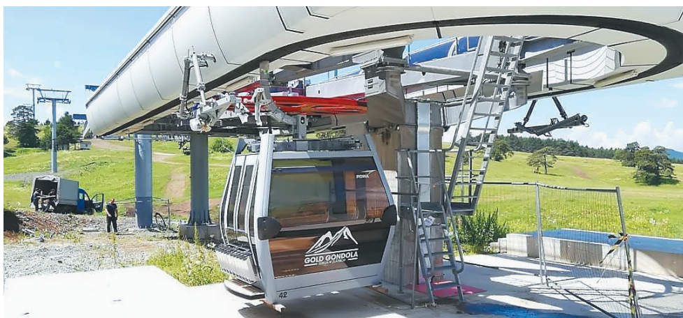
Прва кабина гондоле, за потребе теста, инсталирана је на почетној станици