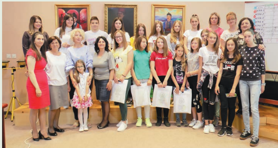
Учесници еко квиза

ницима кроз занимљив приступ и различите игре покажемо колико је битно да чувамо нашу природу, нашу околину за будуће генерације које нам долазе. Ученици су се припремали из материјала који су