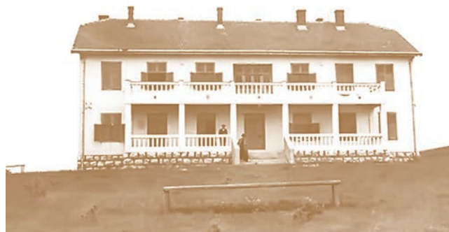
Хотел „Краљева вода“