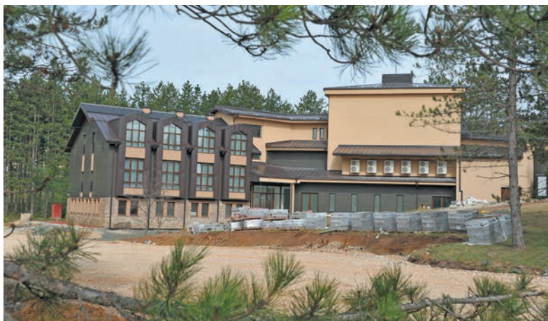
Културни центар на Златибору

милиона динара за изградњу нових путева и улица, као и тендер од 30 милиона динара за реконструкцију постојеће путне инфраструктуре. Ове године све неће моћи да буде завршено, али наредне хоће сасвим сигурно – додаје заменик председника општине, уз напо-