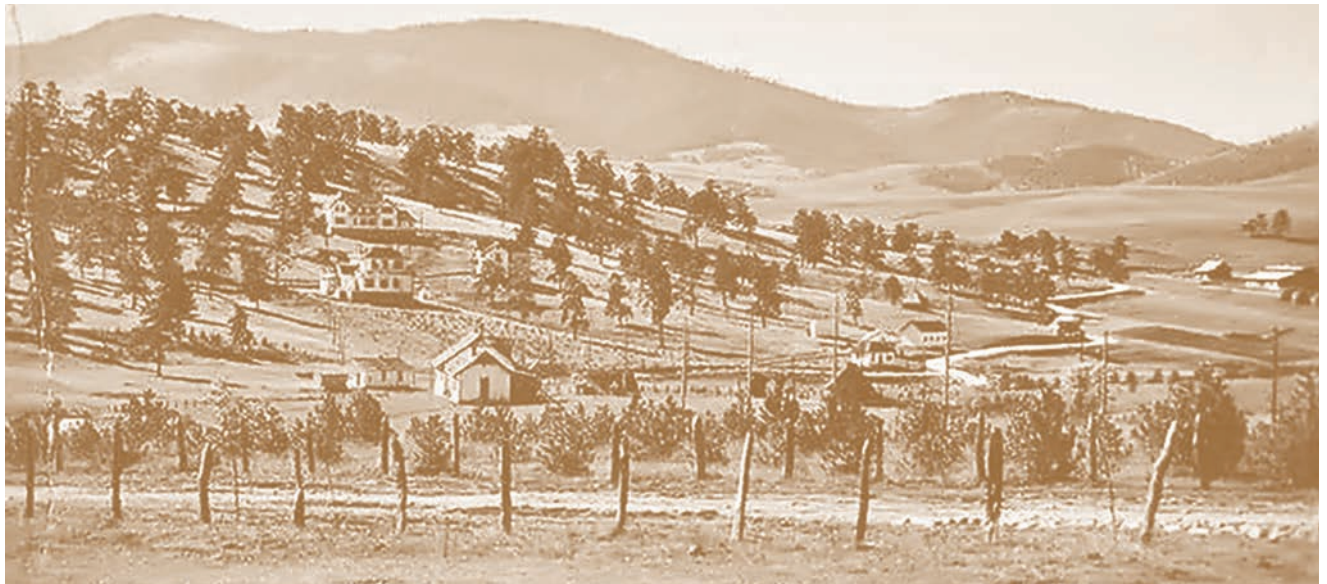
Златибор уочи Другог светског рата