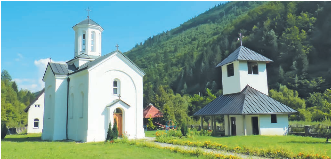
Овај храм посвећен је цару Константину и царици Јелени

сао Милански едикт о равноправности свих вероисповести. Забрањено је прогона хришћана, као и народа било које друге вере. Касније је почео да гради цркве и помаже хришћански народ, да би четврти век хришћанства, како историчари кажу, био златни период за цркву.