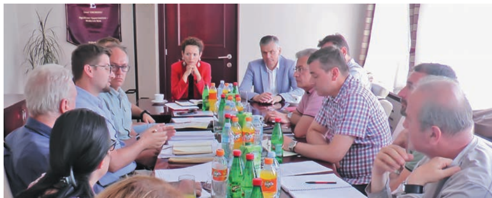
Детаљ са састанка

„За нас је задовољство да радимо на овом великом пројекту гондоле која ће бити најдужа на свету. Партнери смо дуго година и срећни смо што наш корисник, општина Чајетина, има све дозволе да заврши про-