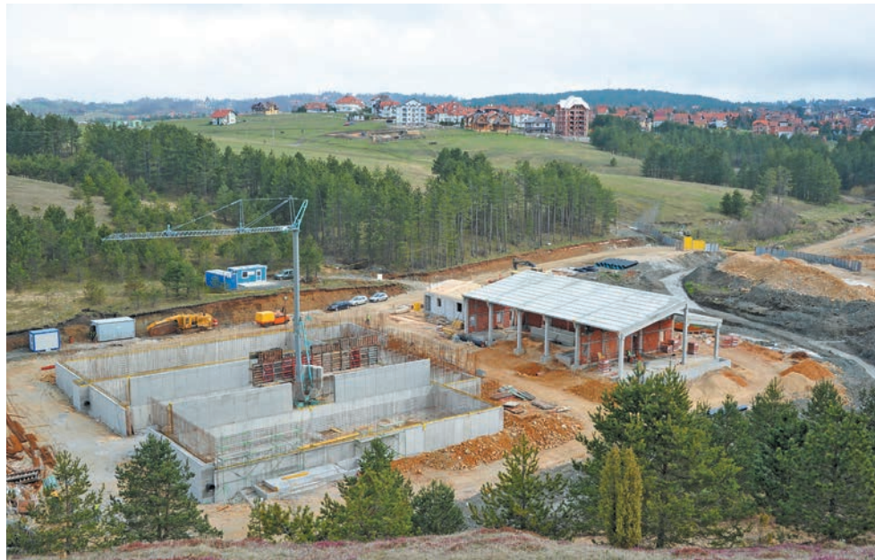
Постројење за пречишћавање отпадних вода на Златибору

но планирали наше приходе и расходе, па је резултат тога буџет који је усвојен у планираним оквирима, што нам сигурно и у наредној години даје могућност и шансу да комотно уђемо у реализацију свих пројеката. Тачно знамо шта су нам обавезе, шта су дугорочни пројекти који се не завршавају у једној години, и тако планирамо буџете. Не бих да испадне да критикујем остале локалне самоуправе, али поуздано знам да своје обавезе прикривају и преносе их у наредне године. Ми тако не можемо да радимо, све инвестиције водимо преко Општинске управе и наравно да надлежне институције преко наших инвестиција, преко трезора то могу да контролишу. Тако да нема шансе да можемо да радимо нешто у овој години, а да одлажемо плаћање у не-