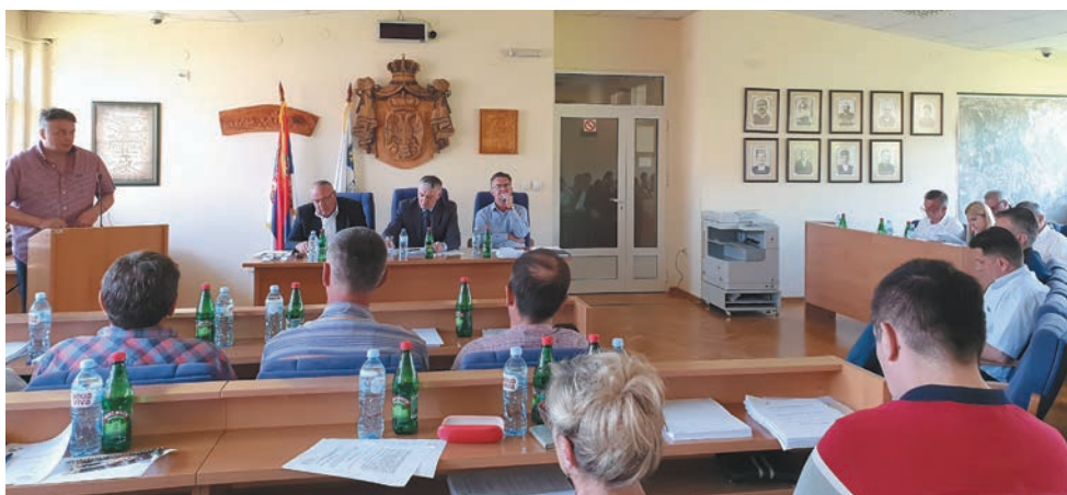
На седници Скупштине општине Чајетина усвојен је завршни рачун општине за 2018.

– До краја ове године интензивно ће се на Златибору радити на уређењу Тржног центра, трга, улице према тениским теренима и до хотела „Торник“. Надам се да ћемо у наредној години до туристичке сезоне све то завршити. М. Ј.