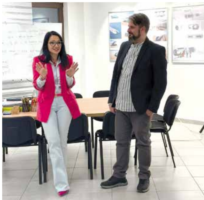
Отварање изложбе студентских радова индустријског дизајна

Од 21. до 24. априла реализована је изложба студентских радова Одсека за индустријски дизајн Факултета примењених уметности из Београда. Поред изложбеног дела, програм је обухватио предавања,