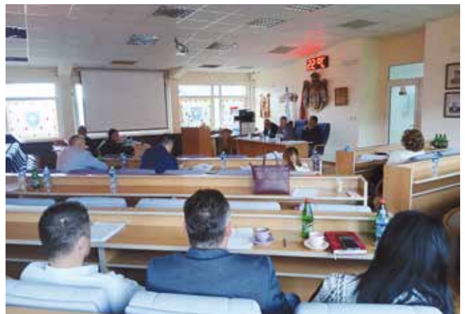
51. седница већа

Веће је дало сагласност на квартални извештај овог предузећа за период од 01.01. до 31.03.2026. године, чиме је потврђено континуирано праћење пословања и реализације планираних активности. Дата је сагласност и на измене и допуне Правилника о раду, и сагласност на измене и допуне Правилника о унутрашњој организацији и систематизацији ЈП „Безбедност саобраћаја Чајетина“, у циљу ефикаснијег функционисања предузећа.