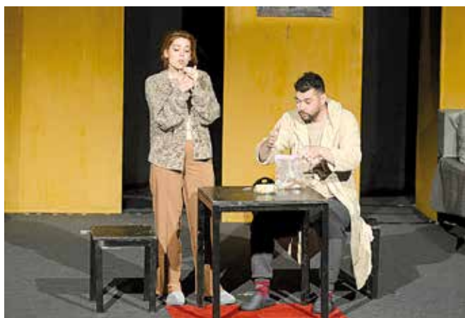
Представа 42 (Равнотежа једноставног анђела)

Позоришни програм започет је 7. априла представом „42“ (Равнотежа једноставног анђела) Народног позоришта Источно Сарајево, која је донела снажну и емотивну причу о емигрантској самоћи и потрази за смислом. Кроз изузетне глумачке интерпретације, публика је имала прилику да доживи суптилан судар рационалног и духовног, страха и наде.