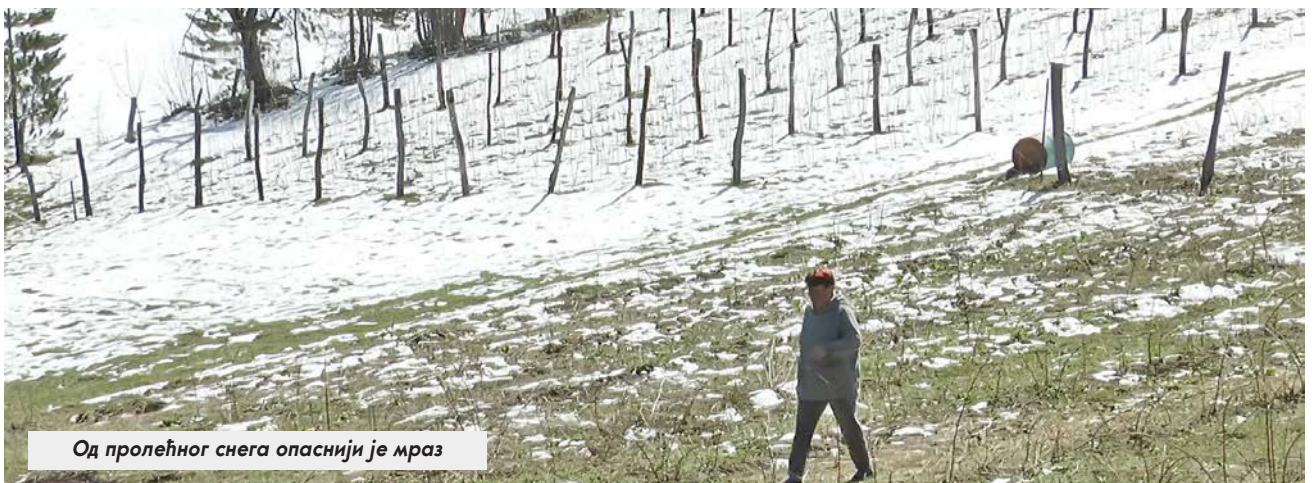
Од пролећног снега опаснији је мраз