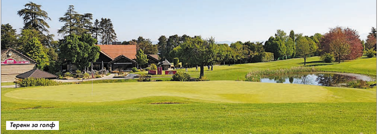
Терени за голф