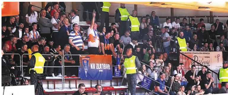
И у Чачку наш тим је имао огромну подршку са клупе и трибина