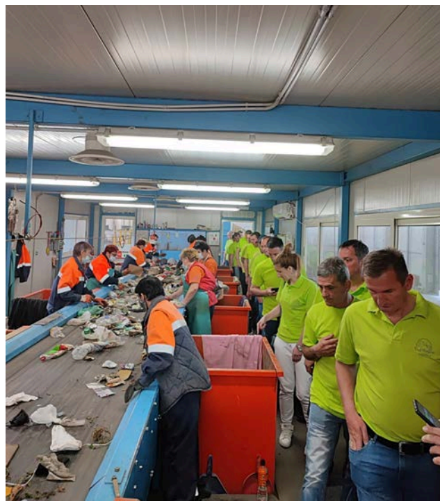
Линији за сепарацију отпада

Другог дана је посећена Брантнер отпадна привреда у Новом Бечеју, а то је била прилика да се од представника предузећа које врши сакупљање и транспорт комуналног отпада у четири општине (Кањижа, Опово, Ковачица и Нови Бечеј) из прве руке чују искуства везана за увођење система примарне селекције отпада,