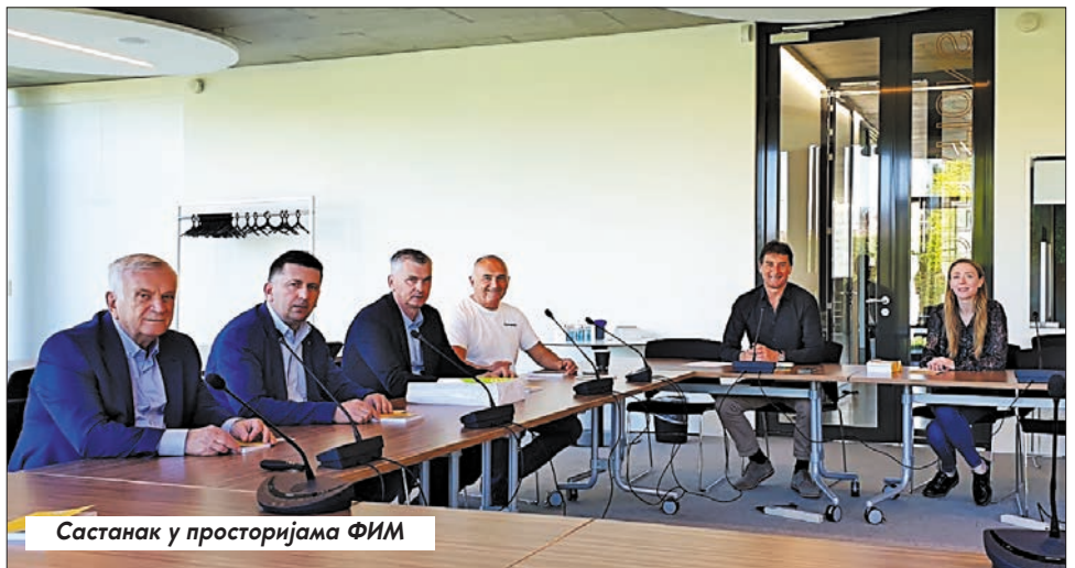
Састанак у просторијама ФИМ