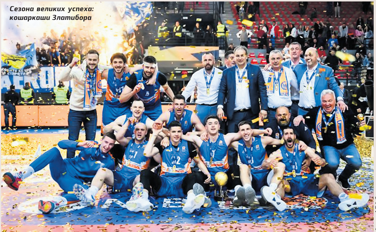
Фото АБА 2

Сезона великих успеха: кошаркаши Златибора