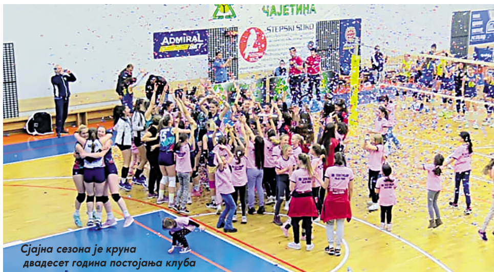
Сјајна сезона је круна двадесет година постојања клуба

У петом сету који је одлучио победника Чајетинке су направиле серију од 9:1 чиме су задале коначан ударац гошћама. Ипак, после меча су обе екипе славиле на терену јер се овим резултатом и „Ваљево“ пласирало у виши ранг, па се у чајетинској дворани заиграло заједничко коло којем су се придружиле и девојчице из омладинског погона „Златибора“.