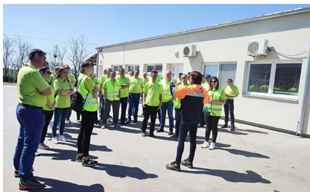
Регионална депонија у Суботици