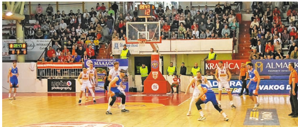
Детаљ са првог меча баража који је чачански тим добио 85:80