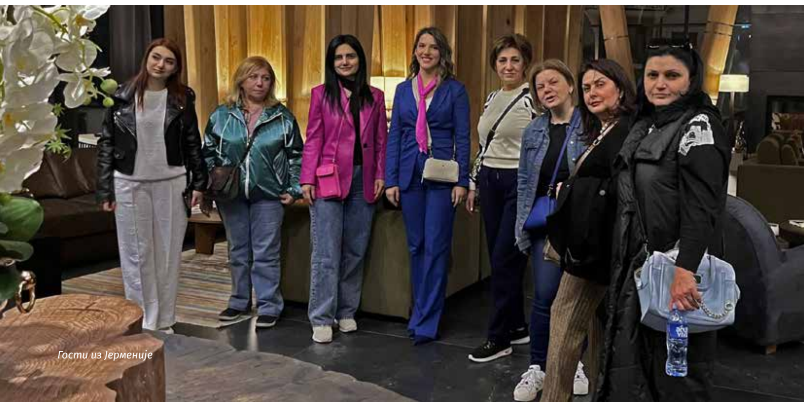
Гости из Јерменије

Промотивне активности пред предстојећу летњу сезону важан су сегмент пословања Туристичке организације Златибор. Обзиром на велику популарност