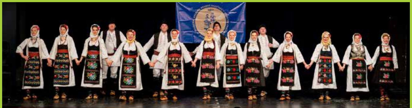
Фото Драган Крацуновић