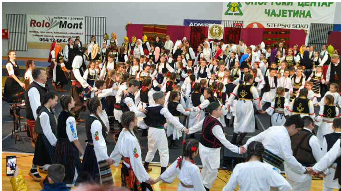
ПРОЛЕЋНИ КОНЦЕРТ УЗННТ "ЗЛАТИБОР"