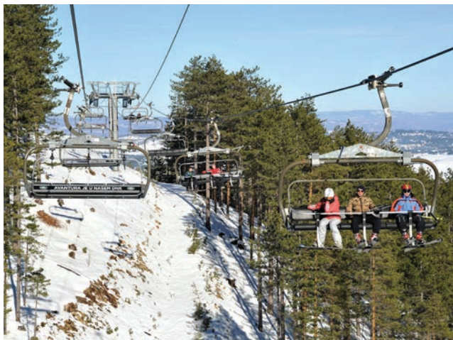
Ски-центар Торник је релативно брзо успео да припреми стазе и скијалиште пусти у рад

-Туристички радници на планини, хотелијери, угоститељи, очекивали су повећан број страних гостију, нарочито из Кине, и сви су се потрудили да се добро припреме - од састављања ме-