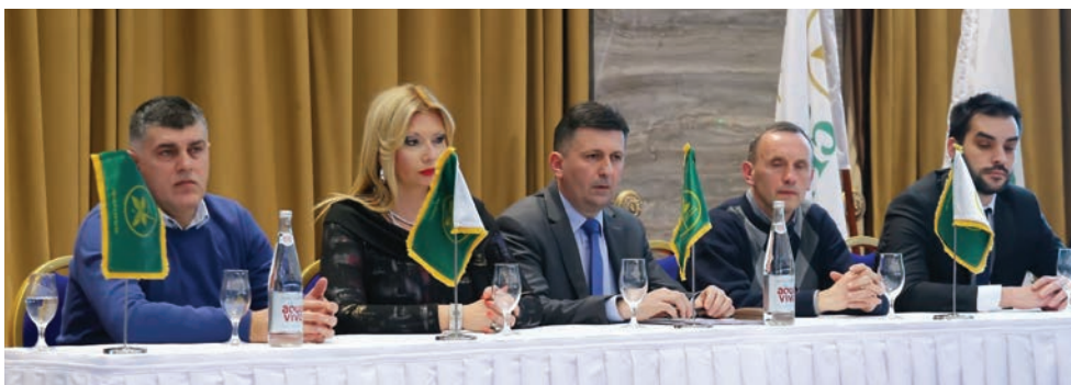
Радно председништво странке