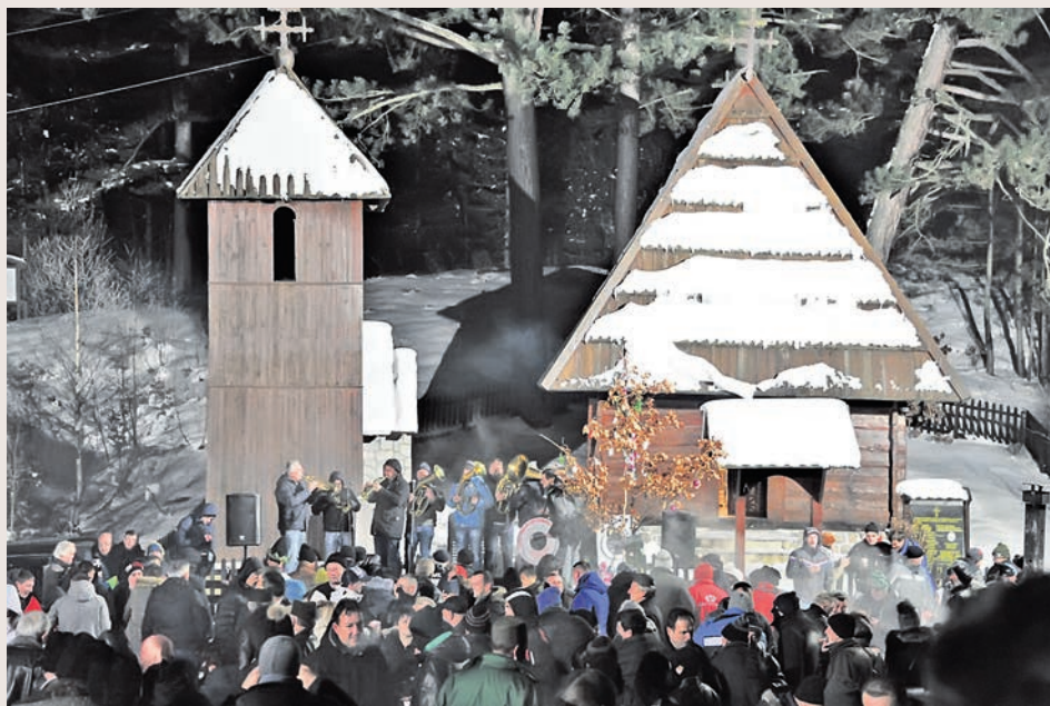
Манифестацију су организовали Туристичко удружење и МЗ Јабланица, под покровитељством општине Чајетина