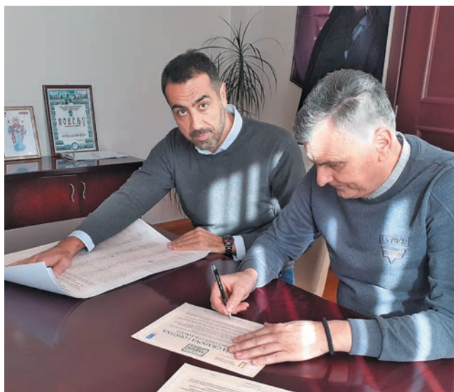
Потписивање повеље о енергетској ефикасности

Општину Чајетина крајем јануара посетили су независни консултанци ангажовани од стране Шведске агенције за међународни развој и сарадњу - СИДА. Циљ њихове посете био је евалуација, односно анализа пројекта „Подршка локалним самоуправама у Србији на путу ка ЕУ – Друга фаза“, чији носилац је КЈП „Златибор“ Чајетина. Пројекат финансира Краљевина Шведске а реализује се уз помоћ Сталне конференције градова и општина. Циљ донатора је да утврди да ли је пројекат који се реализује унапредио рад и досадашња