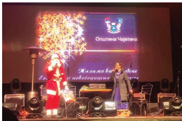
Представа „Наша деца и Деда Мраз“