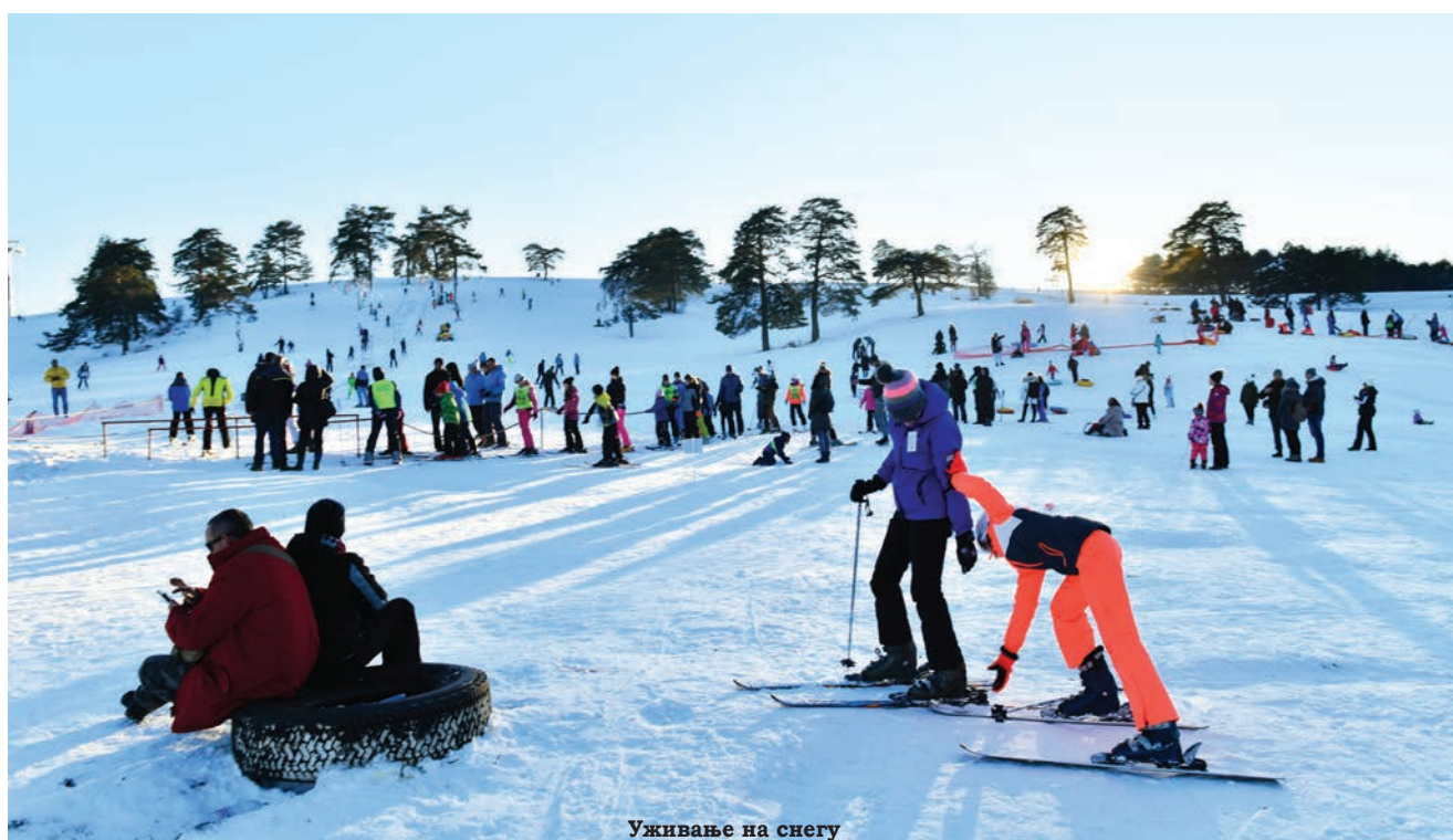
Уживање на снегу

Страних туриста је било 30 одсто више него у истом периоду претходне године