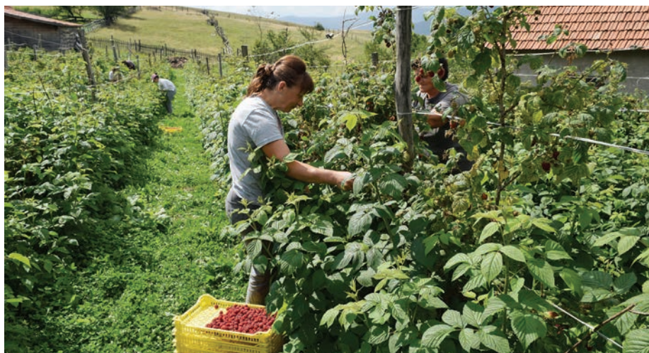
Домаћинстава су се одлучила да се опробају у малинарству и производњи другог јагодичастог воћа

Основно занимање становништва је сточарство и земљорадња. Мештани овог села били су познати као добри мајстори за обраду дрвета (израда кревета, столица, качица за сир и кајмак и сл) и већег броја пољопривредних алата. Село је веома погодно за развој сеоског туризма,