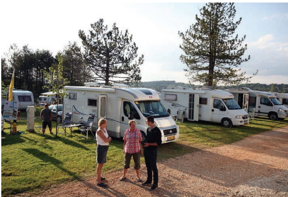
Ауто-камп је проширен са 50 на 65 нових јединица

“Од значајних инвестиција, на Златибору је отворен нови хотел ‘Ирис’, а до краја године очекујемо да ће бити отворен и нови хотел ‘Торник’. То отварање ишчекујемо годинама, а радови су интензивирани, па ће њиме значајно бити обogaћена смештајна понуда високе категорије. Поред апартманског насеља ‘Краљеви конаци’ пре пар година отворени су и ‘Златиборски конаци’ који се стално шире, па ће ове године бити завршена градња затвореног базена и велнес центра. Хотел ‘Олимп’ је добио и затворени базен и велики велнес центар на више од 1.000 квадратних метара. Крајем лета се очекује отварање апартманског насеља ‘Јелена Анжујска’, које се налазу у непосредној близини магистралног пута. Све ће то бити значајни садржаји на Златибору”.