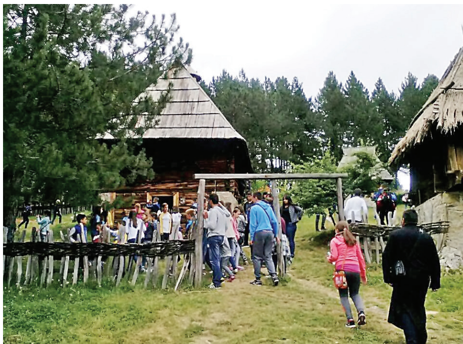
Посета Музеју „Старо село“ у Сирогојну

то се најбоље види на вашем примеру, јер ви упркос тешким условима опстајете. Борите се за своја права, за Србију, а нама у Србији показујете како се бори за свој народ“, поручио је Стаматовић.