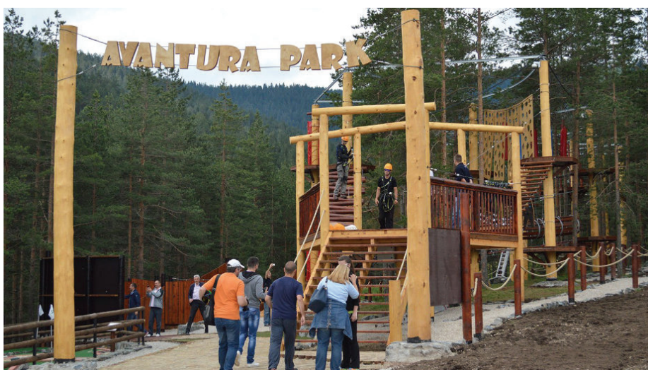
Сваке године нови кутак како би се гостима употпунио боравак на Златибору: Авантура парк на Торнику