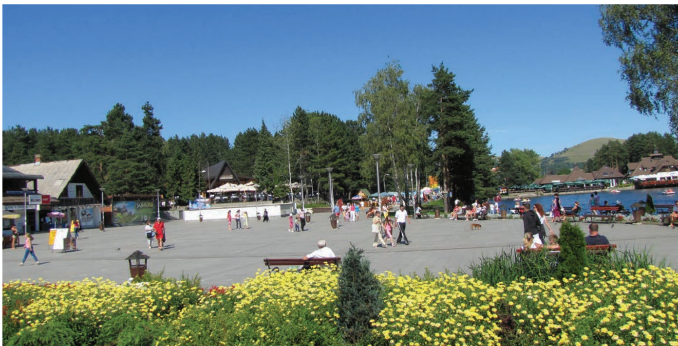
Буџетом општине Чајетина за прву фазу уређења трга и Тржног центра одређено је 15 милиона динара