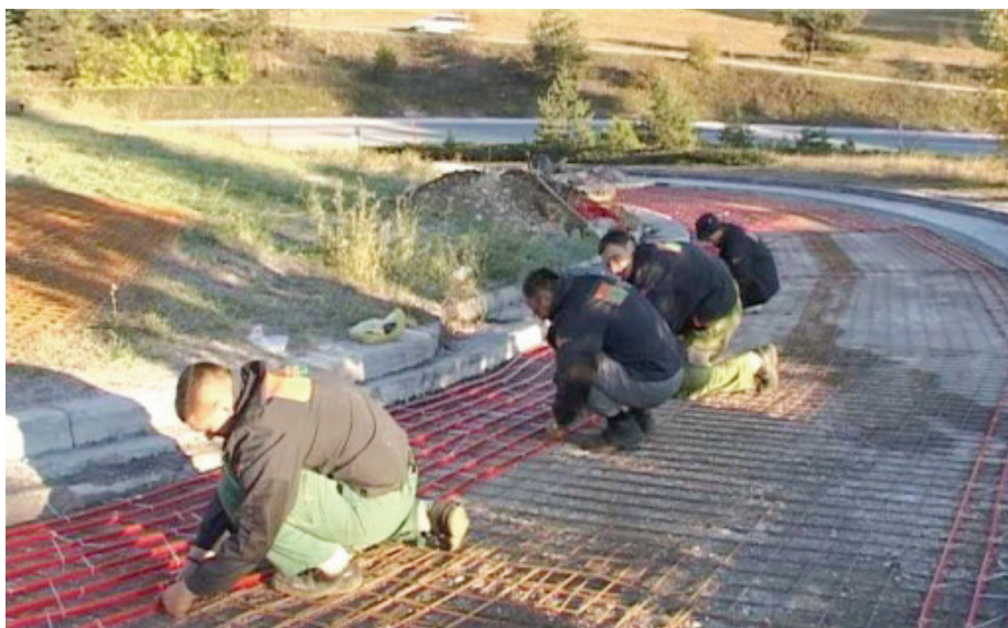
Постављање подног грејања код насеља Чоловића брдо на Златибору