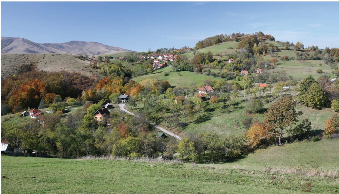
Лепоте Алиног Потока десетак километара од туристичког насеља Златибор