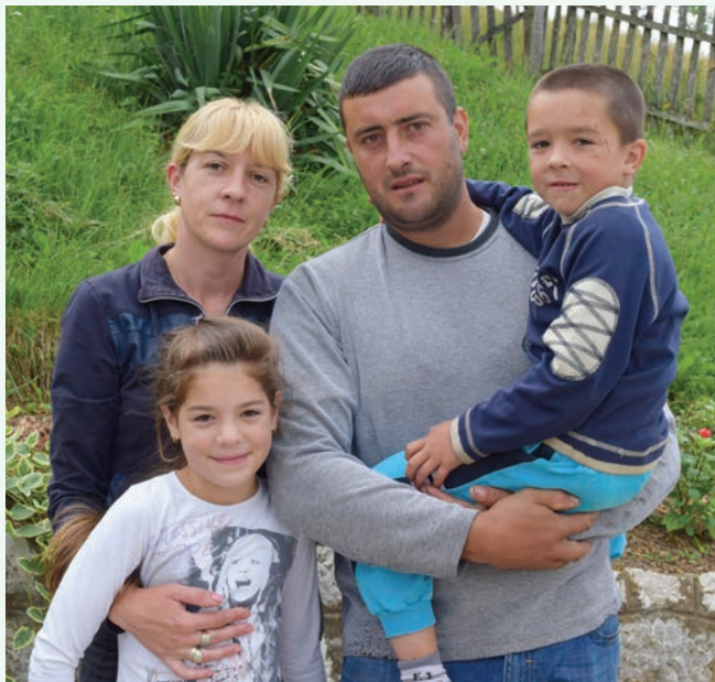
Малине, краве, сир и кајмак, па и љубав према лову у овој домаћинској кући у Алином Потоку