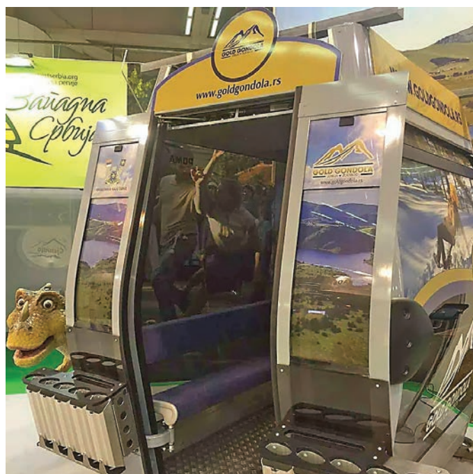
Једна од пристиглих кабина гондоле изложена на Сајму туризма

Иначе, по речима директорке златиборске голд гондоле, да је све било како треба и да је држава на време и по закону решила проблем спорног земљишта, гондола би већ увелико радила. Самим тим, од прихода би се брже и лакше враћале рате кредита.