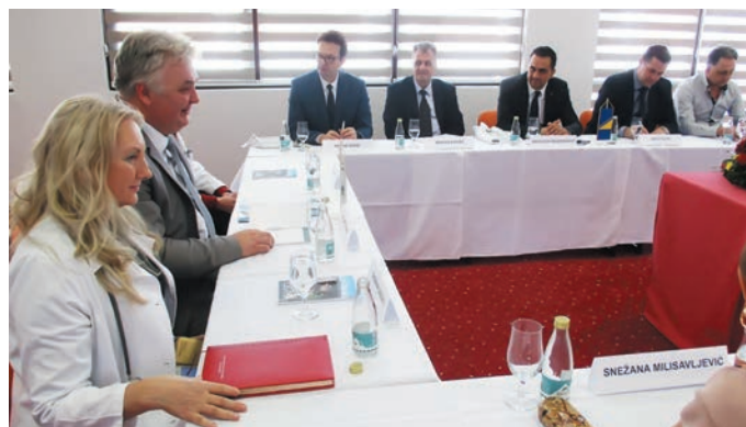
Гости из БиХ упознали су се са здравственом и туристичком понудом „Чиготе“