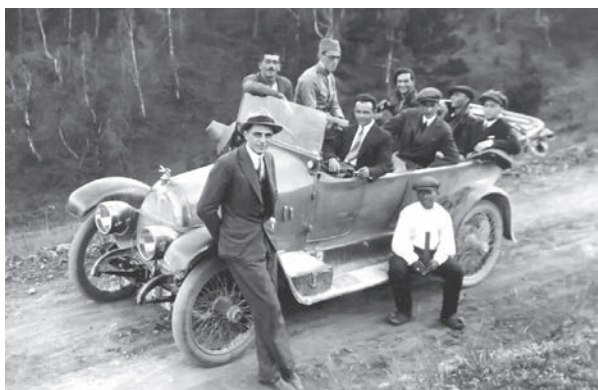
Гости у аутомобилу

Узвишеним гласом објашњава: “...Али ја сада пре-