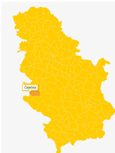
Slika 1: Čajetina-geografski položaj