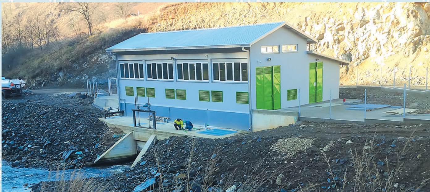
Електрана је прикључена на мрежу ЕПС-а и редовно предаје сву произведену енергију