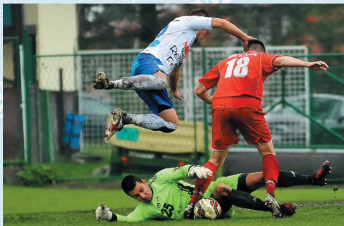
У три сезоне прескочили два ранга и после 15 година вратили се у Српску лигу Запад, где им је место средина табеле