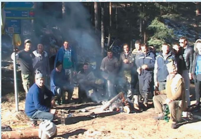
Сад се више ради са машинама и тракторима, али има и где не може без запреге