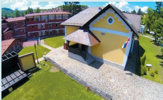
Библиотека „Љубиша Р. Ђенић“ из Чајетине

По њеним речима, важан део рада ове културне установе свакако су и програмске активности. Запослени су се заиста потрудили да обезбеде један садржајан културни живот у Чајетини и да негују фин и добар укус какав њихова публика има. Одржане су многобројне књижевне вечери, промоције књига, тематске изложбе, документар-