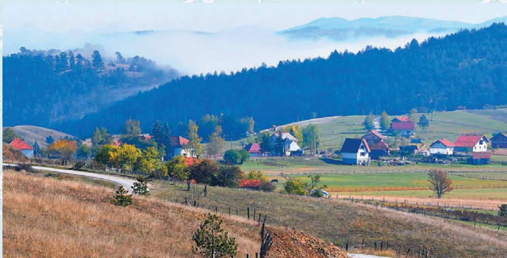
Семеђево, село у првој категорији стратегије руралног развоја