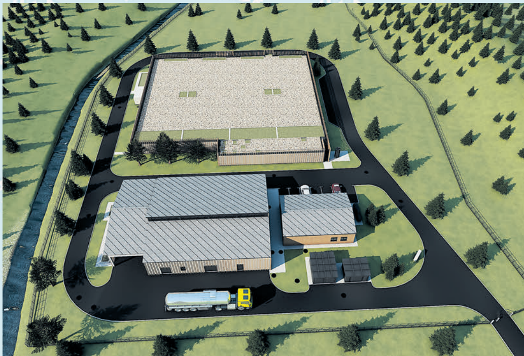
Овако ће изгледати Постројење за пречишћавање отпадних вода на Златибору

Размишљамо дугорочно, размишљамо шире, глобално, а не само локално као што то чине политичке опције када дођу на власт. Мисле да се затворе у своје политичке оквире и мисле да на тај начин, уз помоћ политике, могу да гледају шире, што сматрам највећим проблемом