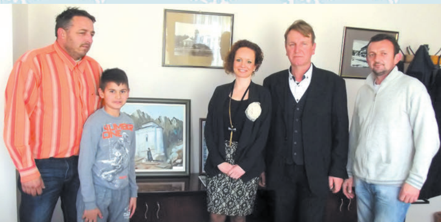
Слику средњовековног града Борча и манастира посвећеног Архангелу Гаврилу предао је представницима општине Чајетина најмлађи члан книћанске делегације