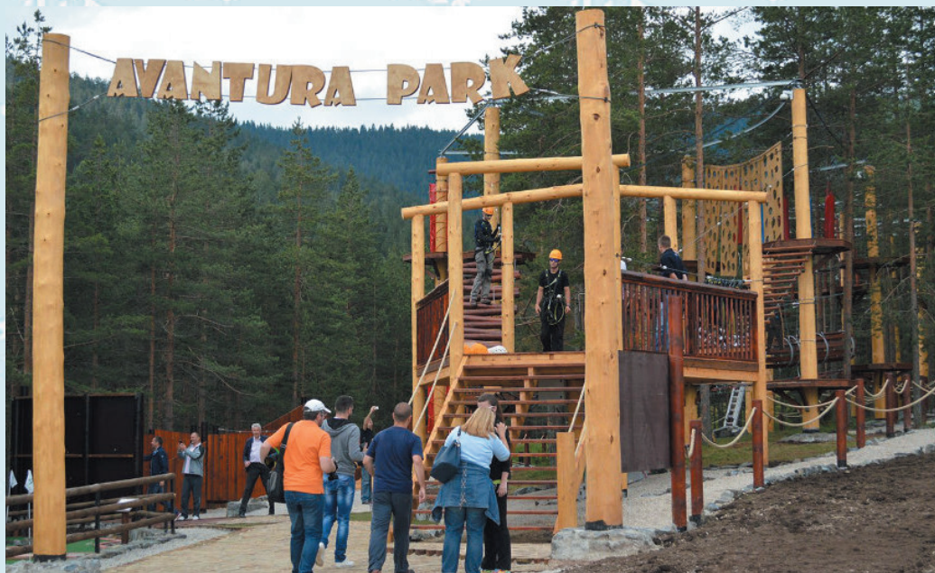
Побољшању понуде допринела је и изградња Авантура парка

Пратећи модерне трендове и технологије у плану је израда нових интернет садржаја, портала, централизованог компјутерског система који ће синхронизовано објављивати све информације о Златибору. Такође, биће интензивнија, организованија и боља промоција на друштвеним мрежама и интернет порталима, а у плану је и унапређење и редизајни-