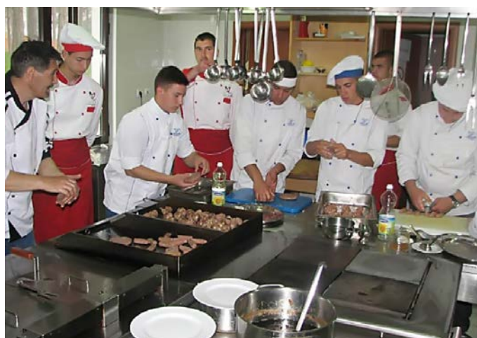
Демонстрација кулинарских вештина

Овај део програма је реализован 14. маја 2017. године. Око 10:00 часова дочекали смо ученике Трговинско-угоститељске школе из Лесковца испред хотела „Зеленкада“. Наши ученици су имали улогу туристичког водича. Испричали су о географским карактеристикама Златибора, легенде о имену Златибора, развоју туризма на Златибору,