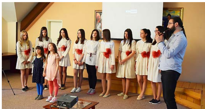
Српска премијера документарног филма о Космету ауторке из Русије одржана у библиотеци у Чајетини

„Имала сам осећај да ако не видим Косово и Метохију једноставно немам морално право да радим на простору Бал-