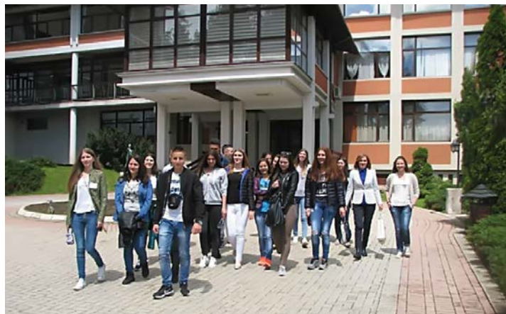
Обилазак болнице „Чигота“