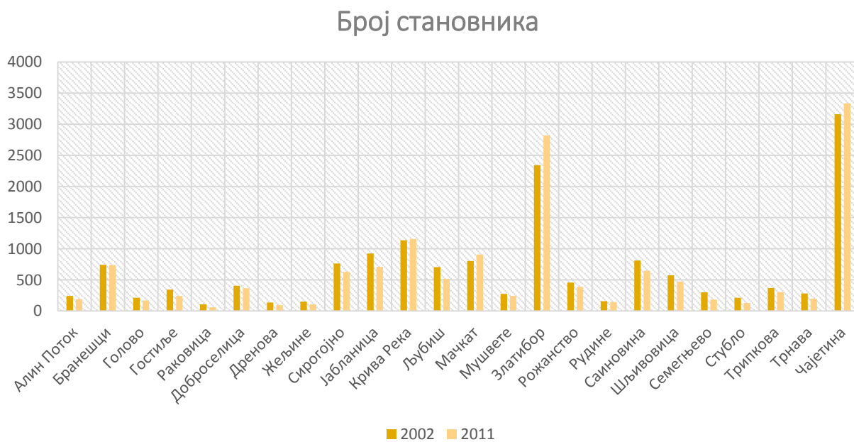
Слика 3. – Упоредни приказ броја становника за 2002. и 2011. годину на територији општине Чајетина