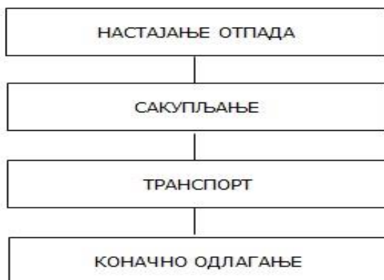
Табела 7. Садашњи систем одлагања отпада

Морфолошки састав се може оријентационо проценити и на основу расположивих података за насеља или градове са сличним бројем становника, климатским условима врстом привредне делатности, сличним степеном стандарда становништва и искуствених података добијених од комуналних организација које прикупљају и дистрибуирају отпад.