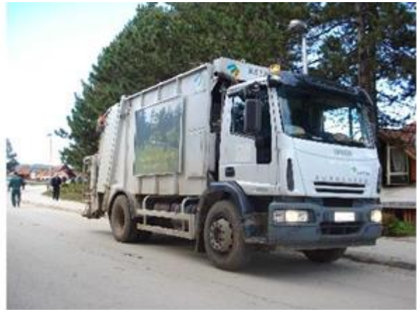
Слика 11. и 12. Возила за прикупљање и транспорт отпада

За потребе КЈП „Златибор“ наручено је још једно комунално возило (смеђара) следећих карактеристика: