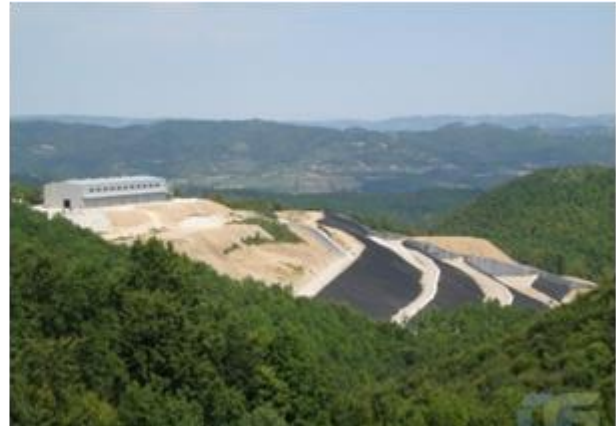
Слика 13. и 14. Комплекс санитарне регионалне депоније „Дубоко“ у Ужицу