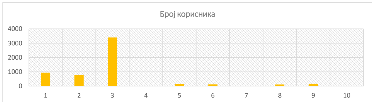
Слика 5. – Произвођачи отпада – број корисника