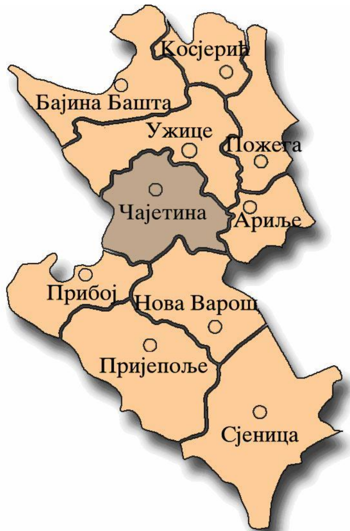
Слика 1. Положај општине Чајетина

Општина Чајетина се налази у југозападном делу Републике Србије, на северу се граничи са општином Ужице, на југоистоку са општином Ариље, на југу са општином Нова Варош, на југозападу са општином Прибој и на западу са Републиком БиХ.