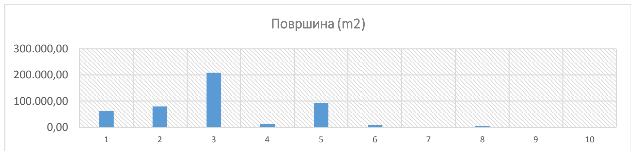
Слика 4. – Произвођачи отпада – површина коју заузимају