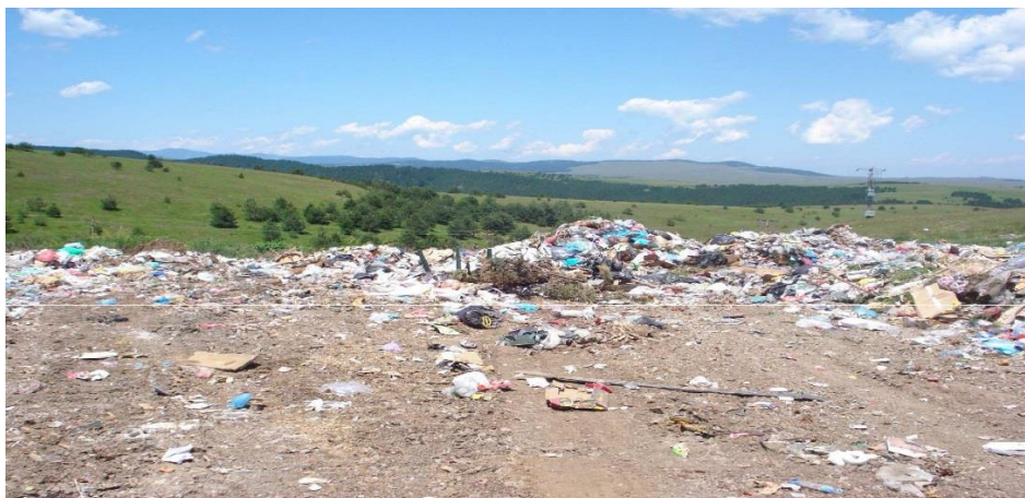
Слика 15. Депонија „Брегови“ на Златибор

Санацијом депонија „Ћетен“ и „Брегови“, санацијом дивљих депонија, као и адекватном контролом и казненом политиком према грађанима и фирмама које на недозвољен начин одлажу отпад, створиће се услови да наша Општина и у еколошком смислу буде достојна реномеа који сада има у туристичком смислу.