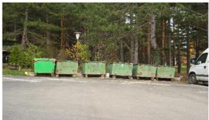
Слика 7 и 8. Судови за одлагање отпада