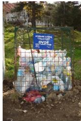
Слика 9. Корпе за отпад