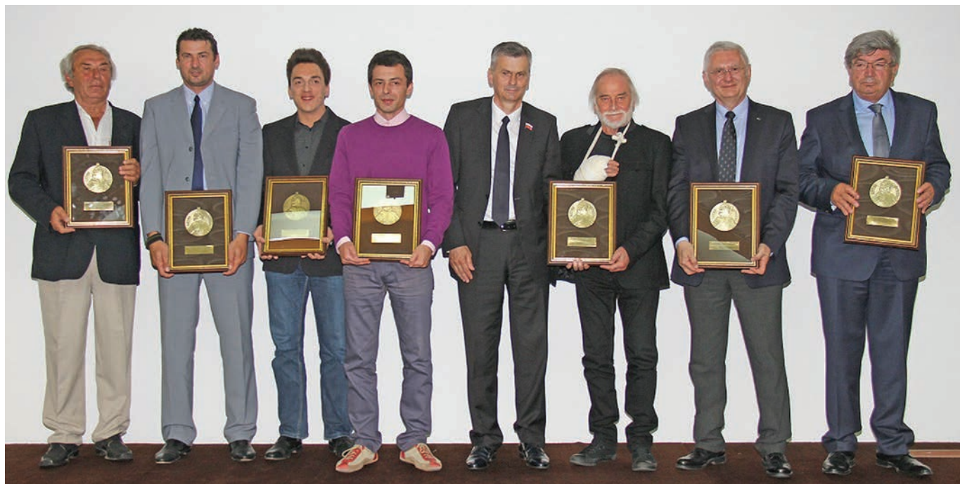
Добитници признања са председником општине

„Ово признање ми је, управо због свог имена, најдраже. Својим именом и обавезује, јер није лако носити назив Витез српске књижевности...Ја имам једно оправдање за ту титулу, јер сам написао једну књигу која говори и о