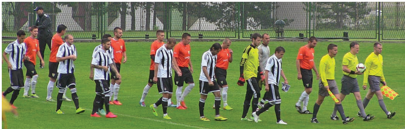
Фудбалери „Златибора” и „Партизана” пред утакмицу 24. јуна на Златибору коју је шампион државе у најјачем саставу добио са 4:0