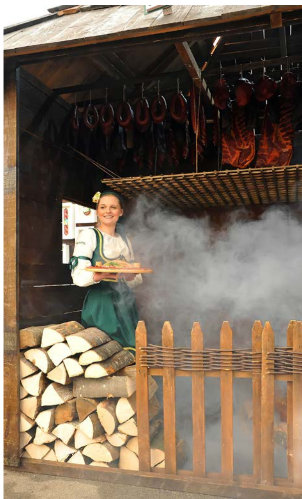
Сушара за месо на пршутујади у Мачкату

„Ужички и златиборски крај одувек је био чувен по доброј пршуту. Још почетком 19. века у овим крајевима грађене су куће од дрвета на високом крововима, такозване ’ошаћан-