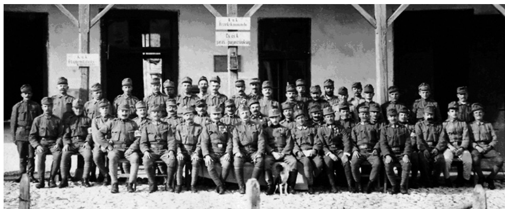
Аустроугарска посада у Чајетини

“Док сам седео у својој канцеларији и прелиставао нека документа, на први дан Ускрса, приметих кроз прозор 5-6 жена и једног дечака од десетак година који се приближавају команди. Пођох им у сусрет, али ме сцена коју видех