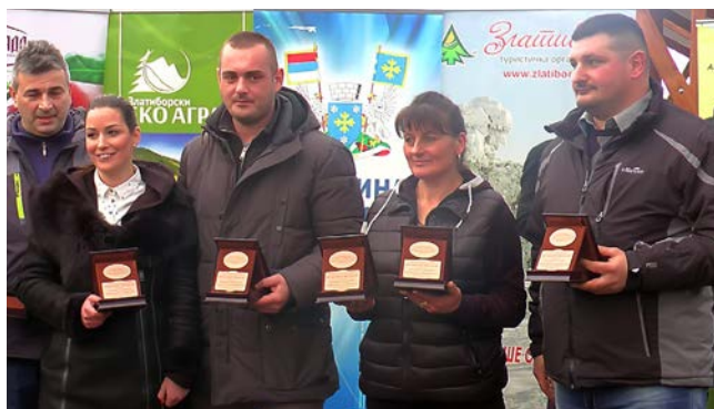
Добитници златних, сребрних и бронзаних одличја

праћеном наступом трубачког оркестра Ивана Митрића из Сирогојна и сплетом народних игара ансамбла УГ „Ветерани Златибора“, присуствовао је велики број посетилаца. Обилазећи богато припремљене штандове одлучили су се и да пазаре неке од златиборских специјалитета, а о њиховом квалитету и самој манифестацији рекли су: