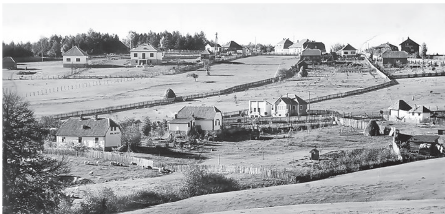
Ваздушна бања Златибор