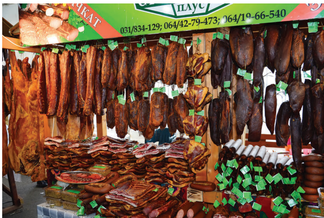
Из године у годину број прозвођача расте, квалитет је све уједначенији

Квалитетом производа је задовољан и директор предузећа „Златиборски еко аграр“ које прати и подржава рад произво-