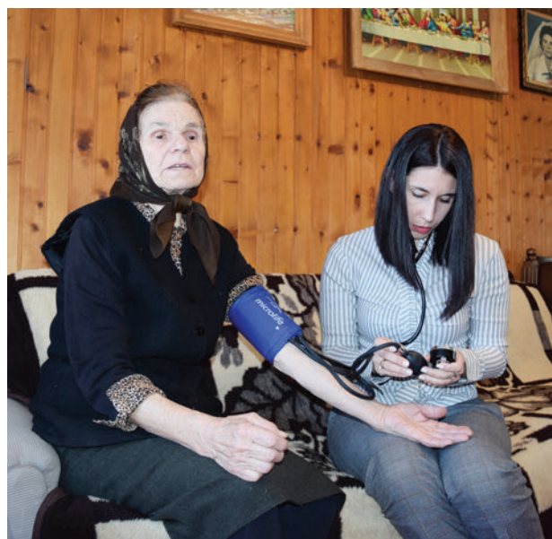
Словенку Бацетић такође редовно посеђују даваоци услуга службе „Помоћ у кући”

►► цивања течности и сл.- углавном се реализује код свих корисника.