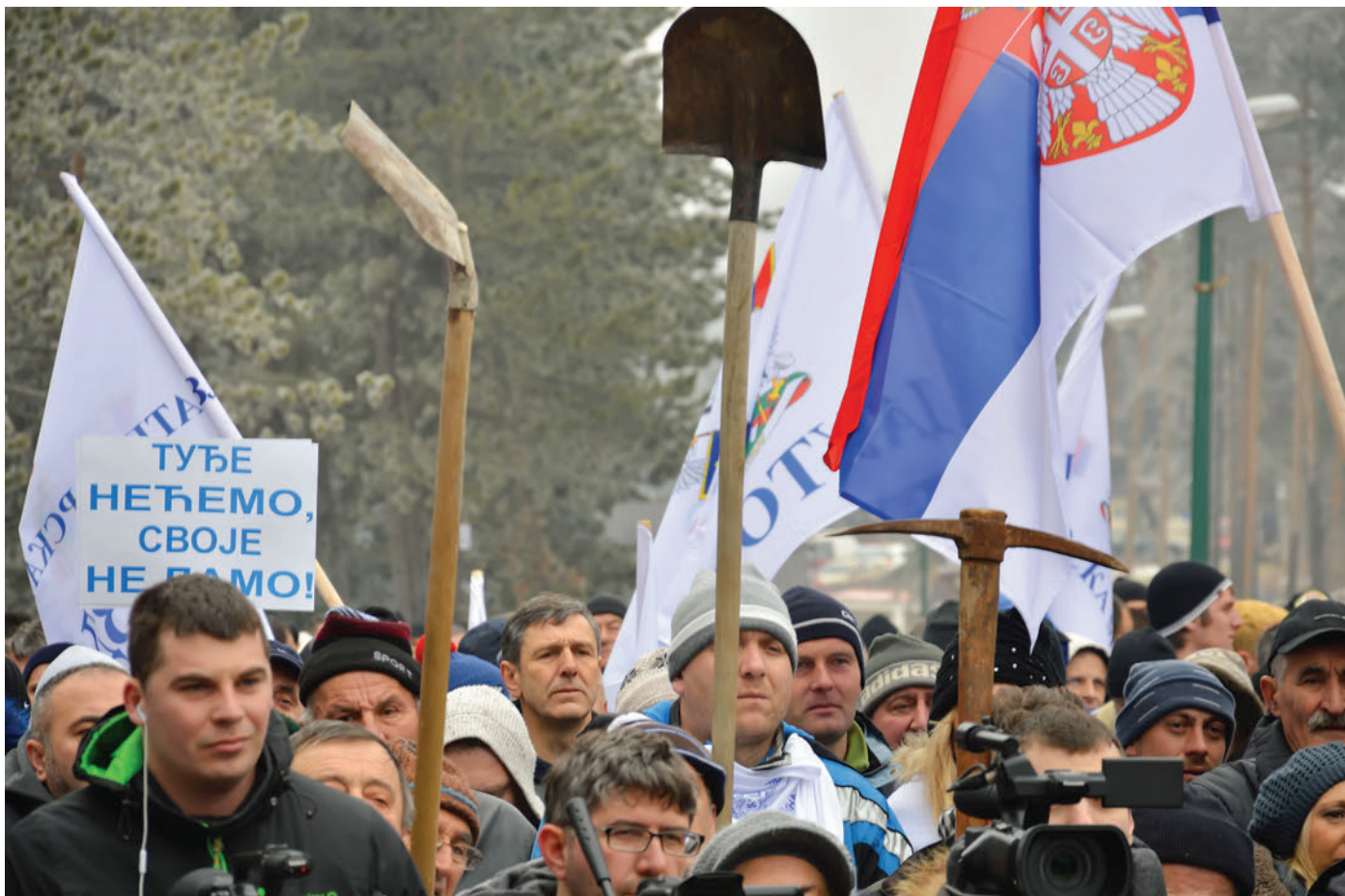
„Златиборска моба 2017.” окупила је неколико хиљада акцијаша из Србије, Републике Српске, Црне Горе...