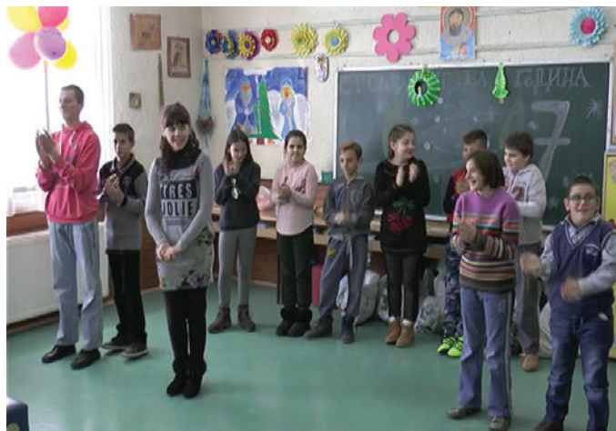
Детаљ са новогодишње приредбе коју су извели деца и омладина из боравка „Зрачак”

Радно време боравка је од 07 – 15 h. Директан рад са корисницима спроводи се у периоду од 8 до 14h. Преостало време предвиђено је за планирање активности, припрему материјала за рад, вођење текуће документације и одржавање простора. Дневни боравак је намењен деци и младима старости од 5 до 26 година. Сви корисници су на евиденцији Центра за социјални рад