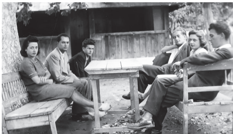
Група пред колибом