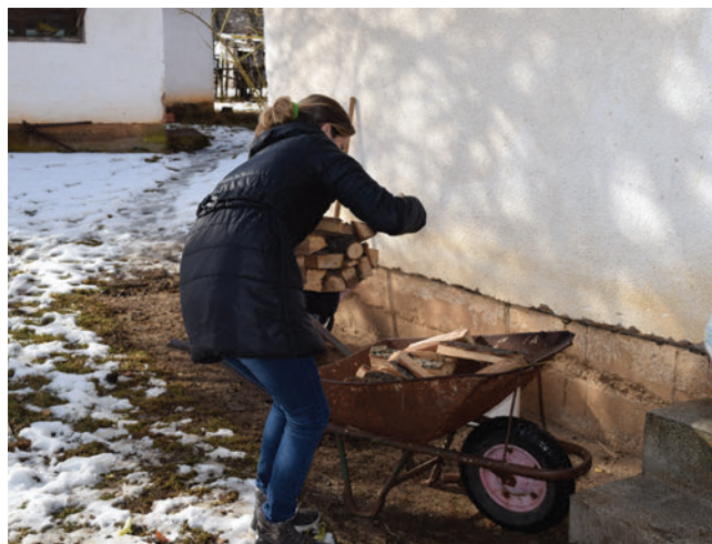
Унесу дрва, почисте кућу, оперу судове, припреме ручак...

„Они су мени долазили три године и нудили ми да ме обилазе. Мени је то било понижење. Док сам била снажнија и јача нисам могла да замислим да је потребно да мене неко гледа, док нисам добила шећер. Да ко зна, као што не зна, како је нама самима, а поготову ко нема деце, па да Бог сузу пусти. Једино петак када дође радујем се овој деци. Све су ми добре. Питају шта треба,