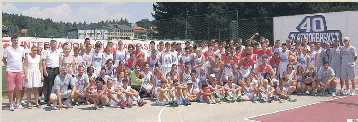
Учесници 40. кошаркашког кампа „Професор Александар Николић”