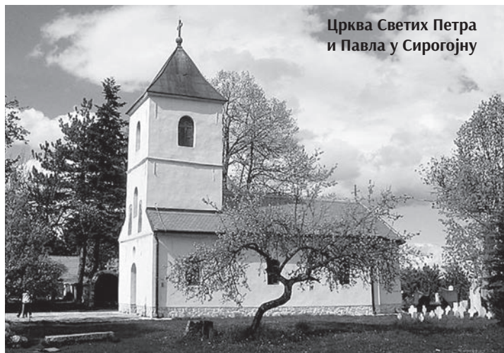
Црква Светих Петра и Павла у Сирогојну