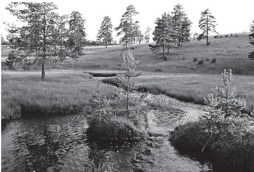
Чувајмо лепоту природе

Од почетка реализације пројекта становници наше општине показали су висок степен свести о значају селекције. Захваљујући томе, Регионалној депонији „Дубоко“ сваког месеца се испоручују све веће количине сувог отпада, што је и био циљ пројекта: за Чајетину еколошки здравија средина, а за „Дубоко“ ефикасније коришћење депоније кроз повећање квалитета и квантитета селектованог отпада.