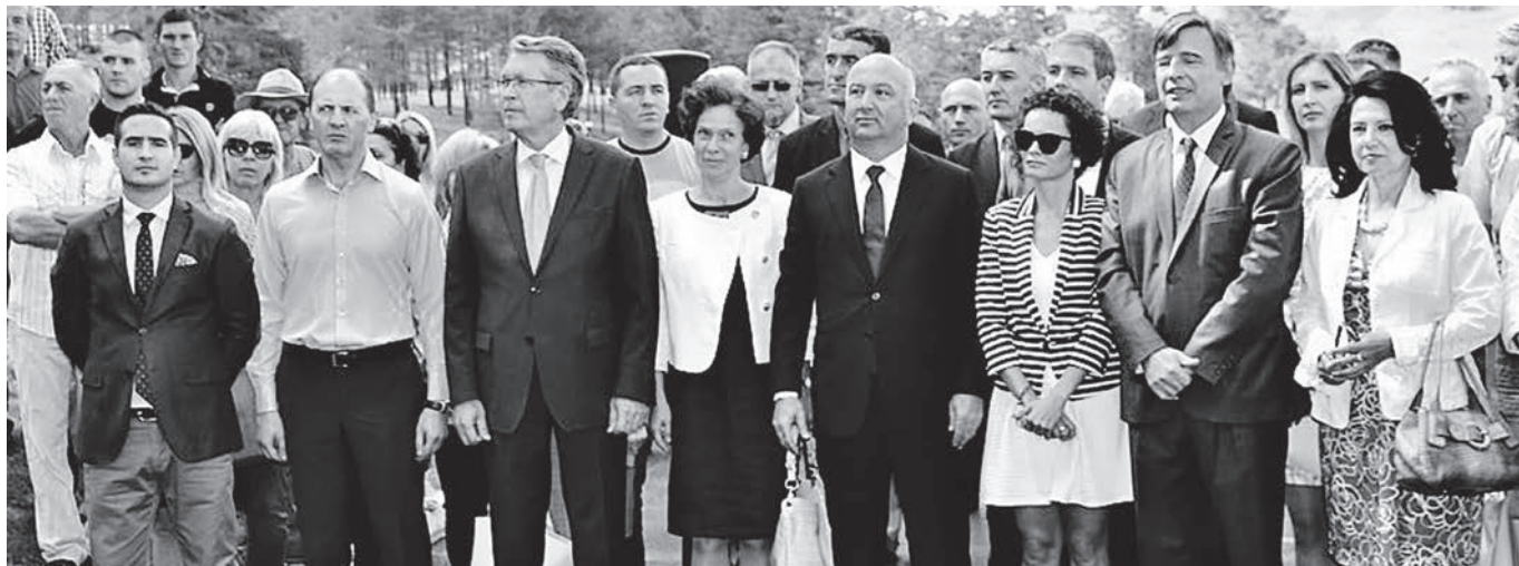
Свечаности су присуствовали и угледни гости