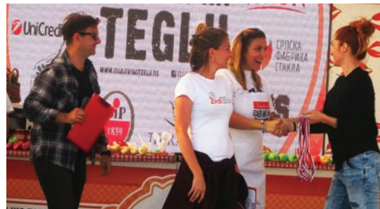
Вицешампиони „Голд гондола“