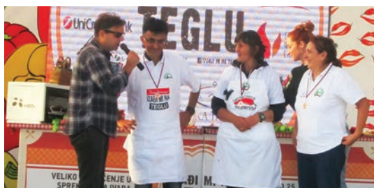
„Попечитељи“ су освојили треће место

тајне. „Ово је традиционалан начин прављења ајвара. Паприку најпре испечемо, ољуштимо и сасмељемо. Додамо уље, со и шећер, без икаквих других додатака. Тако су некада радиле наше мајке и баке“.