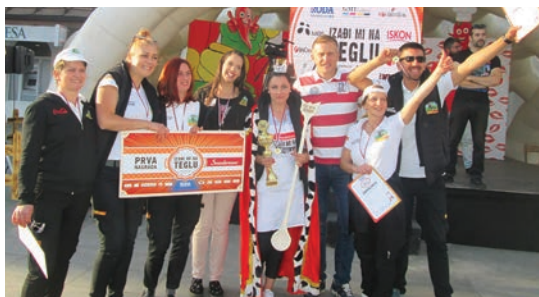
Првопласирани „Дино парк“

Такмичарима су организатори и ове године обезбедили све потребне услове за надметање: накривени штанд за такмичарску екипу, столице, пећи за печење паприка и припрему ајвара, дрва, тегле, свежу паприку, уље, шећер и со. Учесће је, по речима