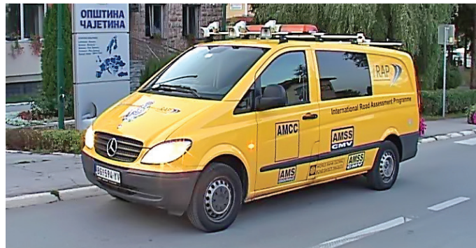
Специјално возило за снимање најкритичнијих путева

о обележјима безбедности саобраћаја. Ова фаза треба да буде реализована кроз три нивоа: један је успостављање базе која треба да нам да податке о саобраћајним незгодама и њиховим учесницима, информације о путевима и безбедносним